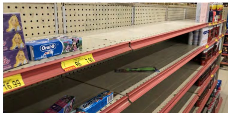
Prateleiras com poucos produtos mostram esvaziamento da loja

A comerciante ainda disse que, ultimamente, o fluxo de clientes vem caindo consideravelmente na região. “Quando a C&A fechou, já diminuiu muito os clientes. Até por aqui na Americanas. Aí se ela fechar também, vai piorar muito. Não sei o que vamos fazer”, disse preocupada.