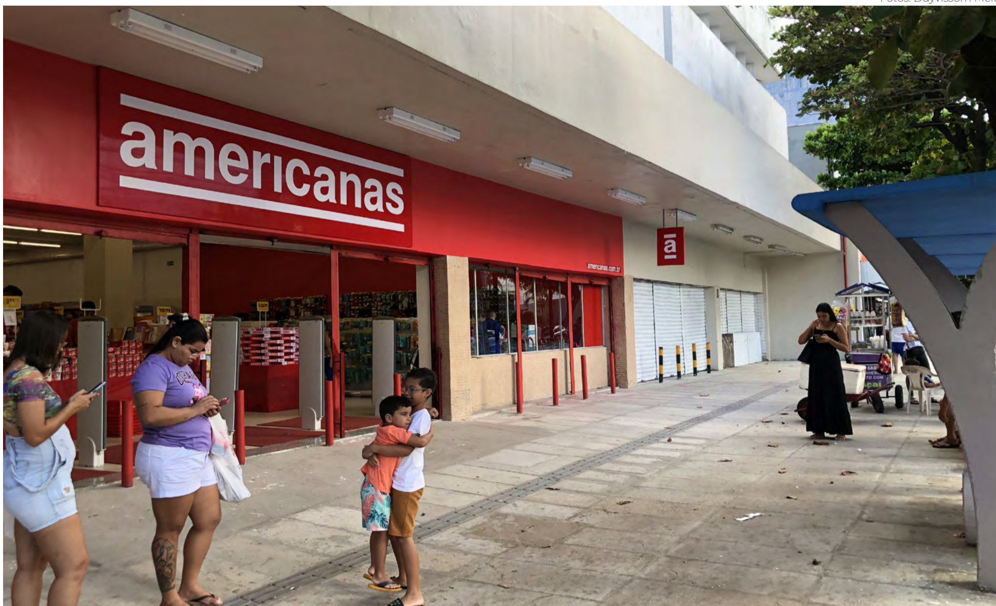
Localizada na Cidade Alta, loja mais antiga do grupo em Natal, mostra claros sinais das dificuldades enfrentadas; funcionários negam mudanças