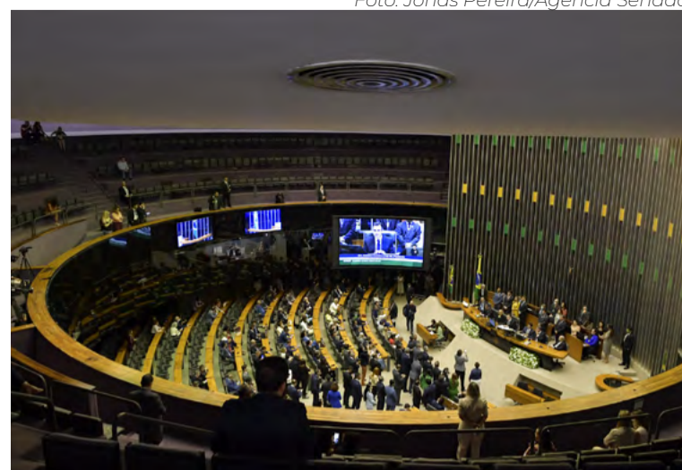
Congresso tem projetos para simplificar sistema tributário