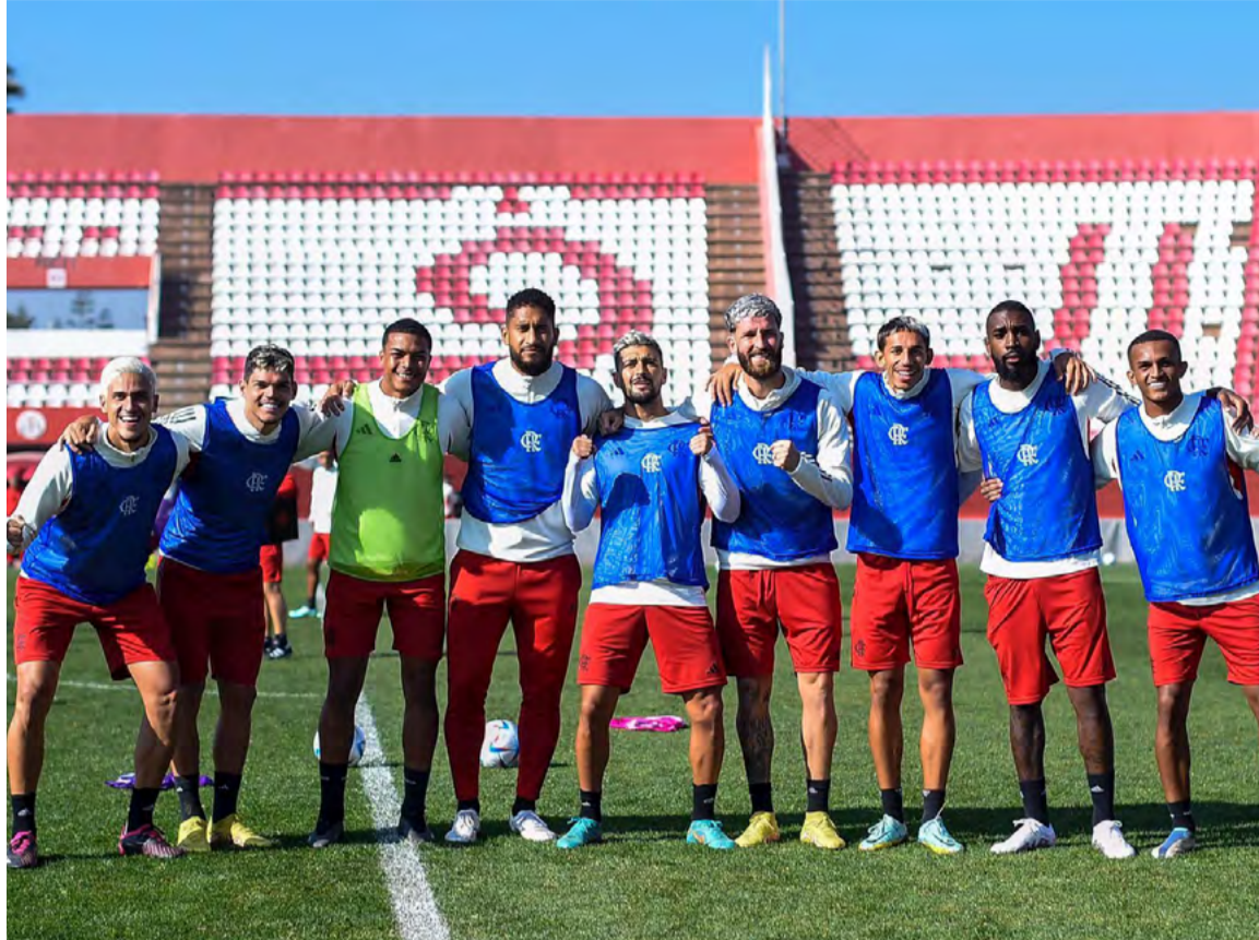
Estreia será contra o Al-Hilal, da Arabia Saudita, no Ibn Batouta Stadium, no Marrocos