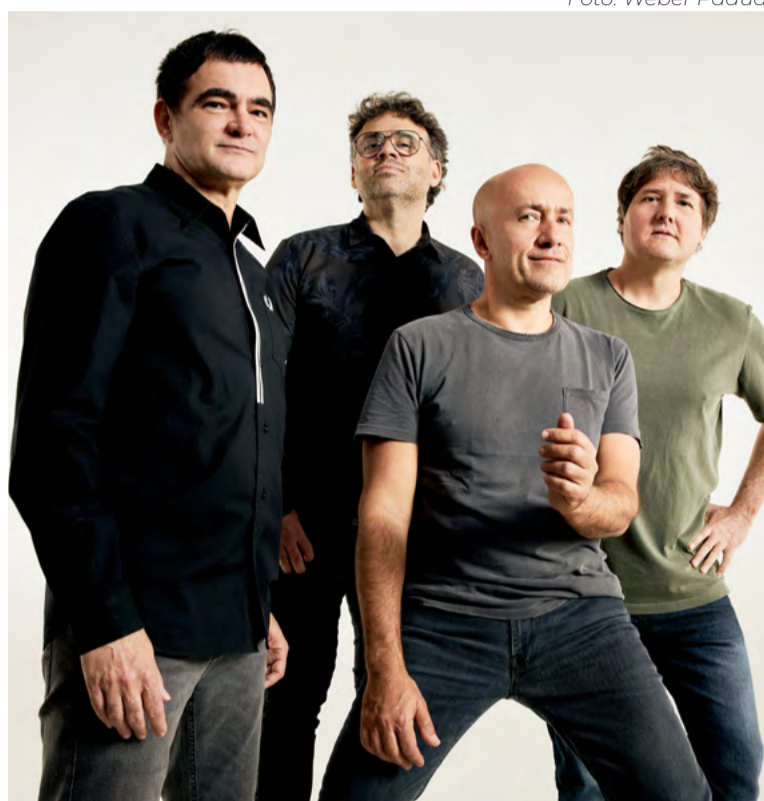
Grupo mineiro fará despedida final em março deste ano

Sobre as músicas que mais marcaram a história do Skank, Portugal disse que a escolha seria injusta com todas as outras obras do grupo. “São muitos os singles que fazem parte da vida dos fãs, da nossa carreira e que nos levaram a tantos lugares. Cada música teve sua importância na história da banda e construiu o que somos hoje”, afirmou.