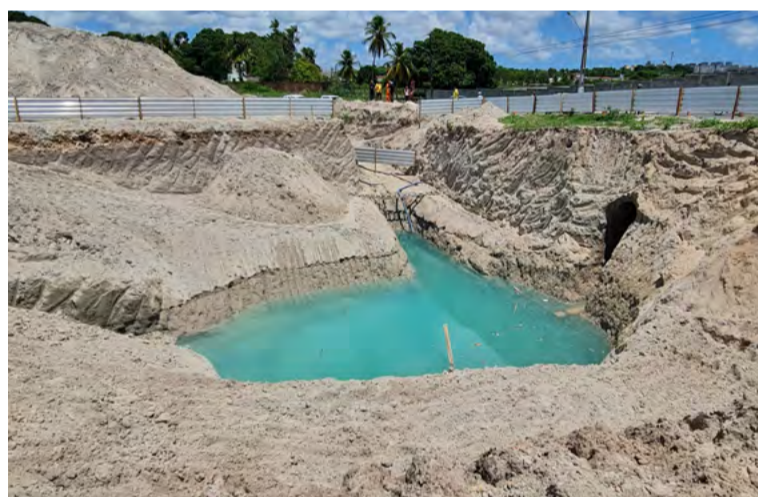
Segundo a Caern, quilômetros de rede já foram concluídos