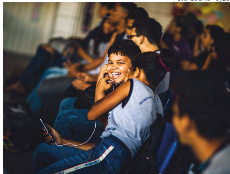
Alunos de 15 escolas públicas de Natal participarão do projeto

Vale ressaltar que uma das preocupações da direção é levantar discussões que tratam a sustentabilidade também como ponto central e de grande importância a ser discutido. Inclusive ao final da temporada, serão selecionadas duas escolas para receberem a aula sobre "instrumentos reciclados", com o grupo Pau e Lata.