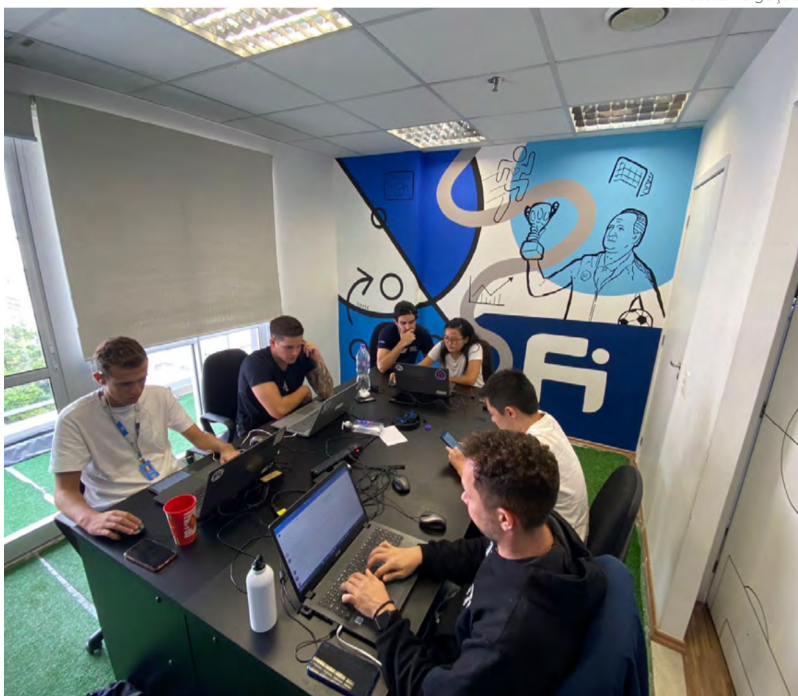
Startup promove cursos sobre o futebol com professores de vários lugares do mundo