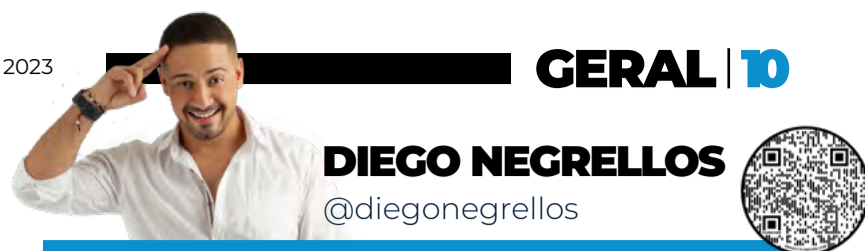
DIEGO NEGRELLOS @diegonegrellos