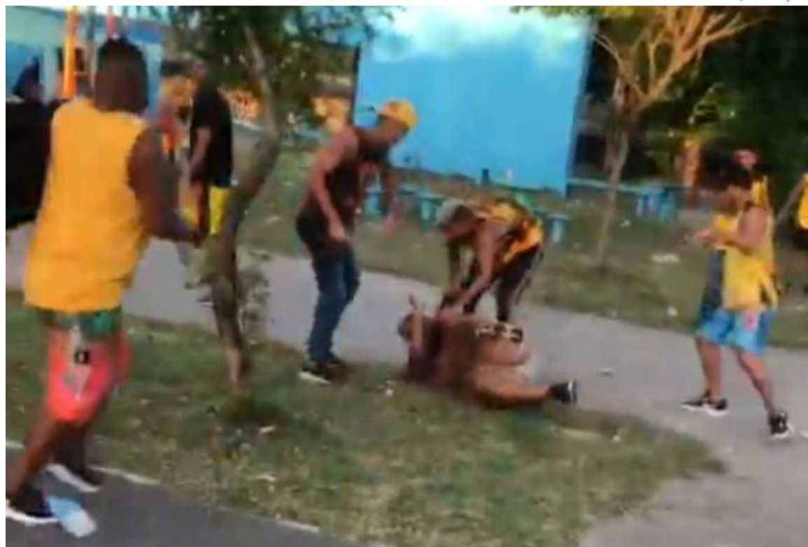
Confusão entre torcedores do Sport e ABC ocorreu no sábado (21), em Pernambuco