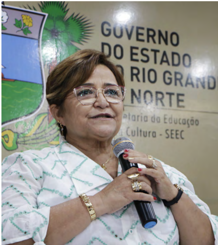
Socorro Batista nasceu na cidade de Frutuoso Gomes

Dos 21 secretários para a nova gestão da governadora Fátima Bezerra (PT), oito mulheres estão no primeiro escalão do governo - o dobro da primeira gestão de Fátima. A nova titular da pasta terá uma das missões mais difíceis no segundo mandato petista, pois a Educação foi uma das áreas mais criticadas ao longo dos últimos quatro anos.