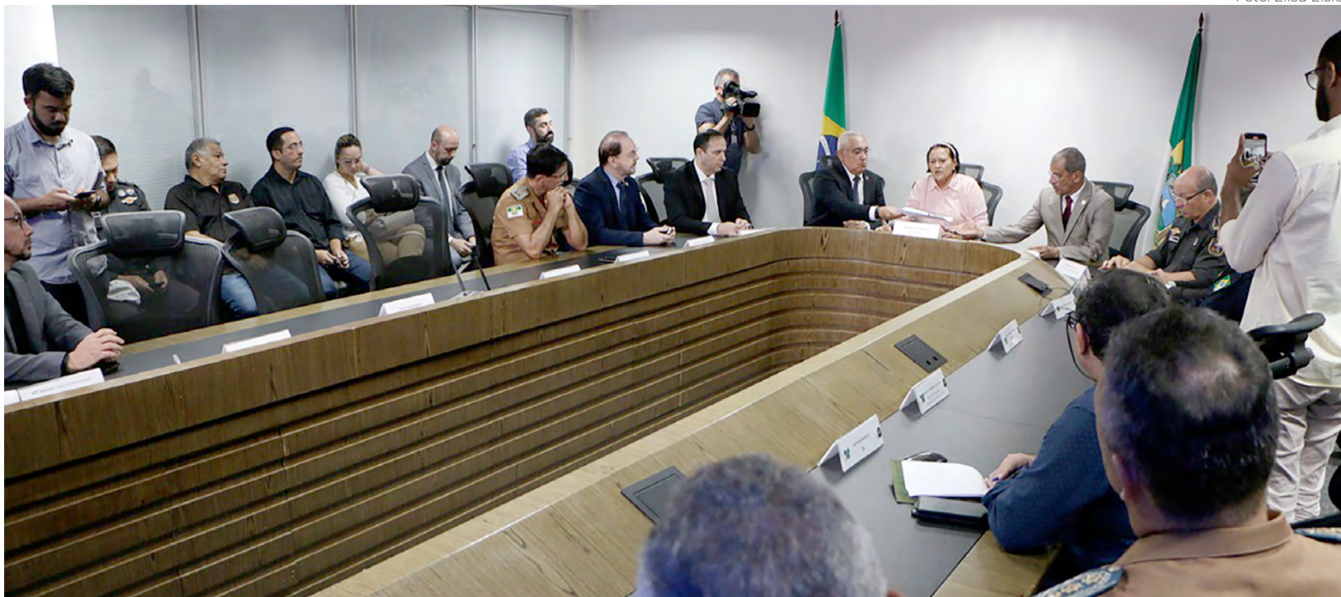
Governadora Fátima Bezerra (PT) instaurou Gabinete de Gestão Integrada para cumprir a mais recente decisão do ministro Alexandre de Moraes, do STF