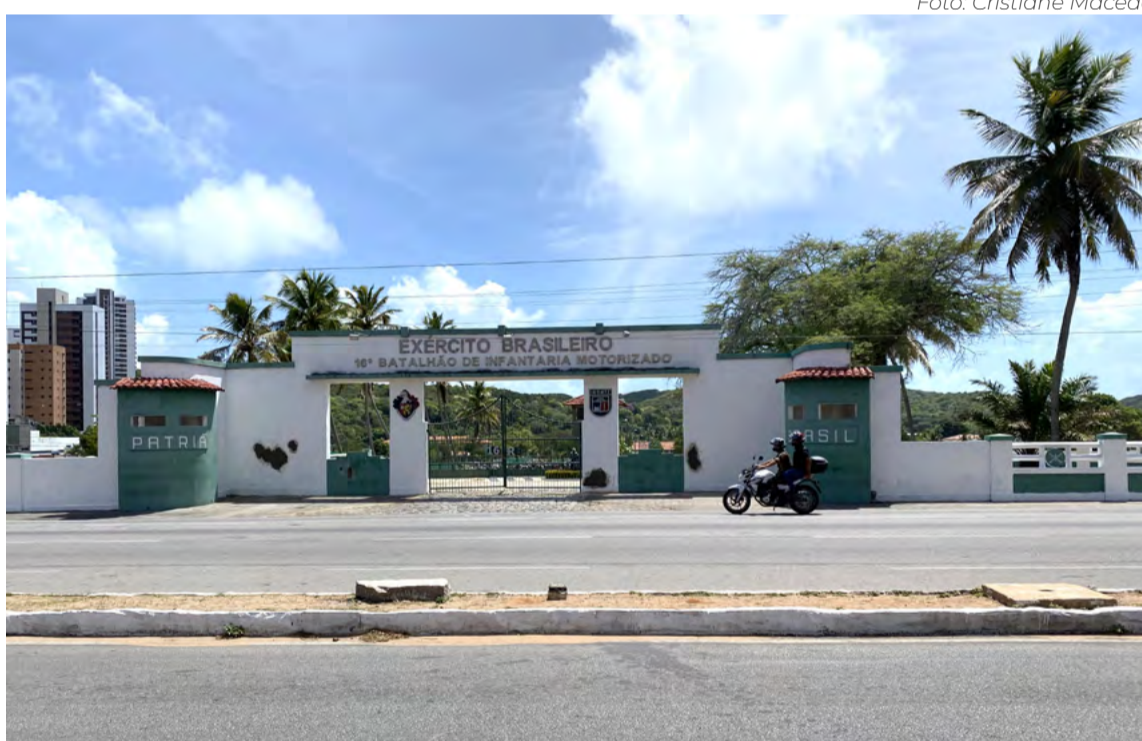
Portão de entrada do 16º Batalhão do Exército foi palco de manifestações antidemocráticas

Ainda na manhã desta segunda-feira, o governo potiguar instaurou um Gabinete de Ges-