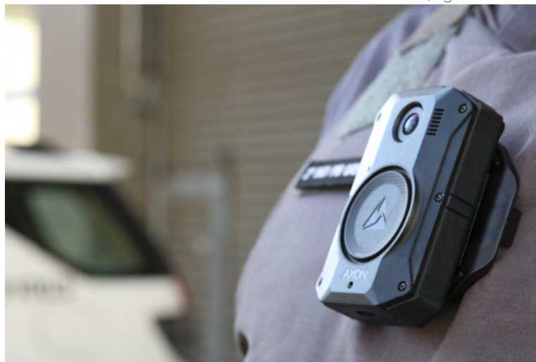
Policiais da Rocam serão os primeiros a utilizar a Bodycam

“Outras forças e batalhões da Instituição serão contempladas