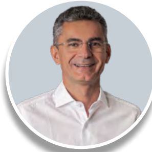
FRANCISDO DO PT (PT)