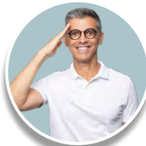
CORONEL AZEVEDO (PL)