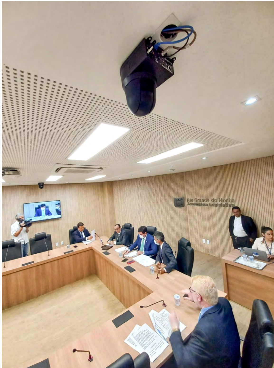
Transmissões contarão com 14 câmeras robóticas Full HD, instaladas no plenário e nas salas de comissões temáticas

Outra novidade que será implantada na emissora para este ano será a disponibilização da programação de forma on-line, a exemplo do que acontece no Legis Vídeos. Será criada uma ferramenta própria. “Assim como acontece com o Legis Vídeos, nós iremos criar uma ferramenta que vai disponibilizar para todo o público, interno e externo, os vídeos da programação da nossa TV. Então, as pessoas poderão baixar e assistir todo o nosso conteúdo, quando e onde quiserem”, explica Bruno Giovanni.