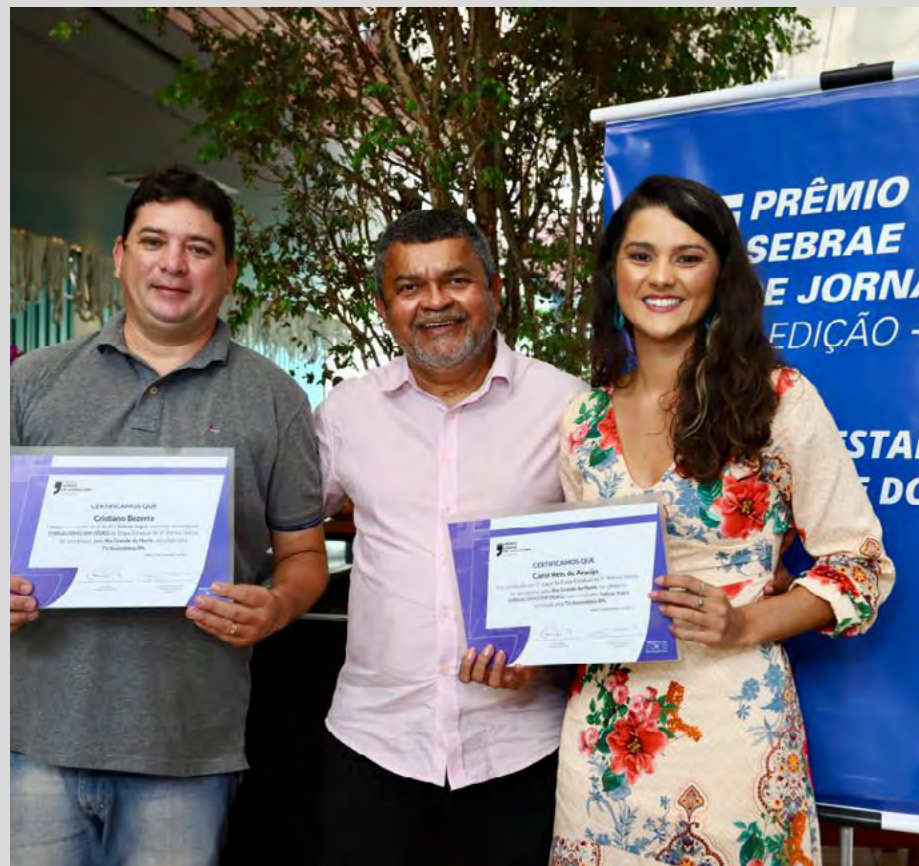
TV Assembleia ficou com o 3º lugar no prêmio em 2022

imprensa, parceiros do órgão. “O Prêmio vem valorizar aqueles que cobrem a pauta do empreendedorismo no Rio Grande do Norte, os jornalistas, parceiros nesse grande desafio”, disse. A TV Assembleia pode ser assistida em Natal e Região Metropolitana no canal 10.3. No interior, canal 18.1. Na TV fechada em Natal, o sinal é transmitido pela Net no canal 16 e canal 109 pela Cabo Telecom. Já em Mossoró, TCM 21.4 e 222. Assu, Telecab 04. Currais Novos, Sidy's Catv 56 ou ainda no site www.al.rn.gov.br e no canal oficial da TV no YouTube.