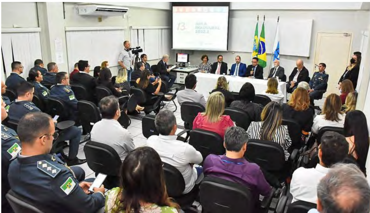
Em 2022, a Escola da Assembleia Legislativa do Rio Grande do Norte certificou um total de 1.248 alunos

A Escola da Assembleia participa do Sistema Nacional de Ensino Legislativo, formado por órgãos educacionais do Senado Federal, da Câmara dos Deputados, do Tribunal de Contas da União, de Assembleias Legislativas Estaduais, da Câmara Legislativa (DF), de Câmaras Municipais e de Tribunais de Contas Estaduais, articulado pela Associação Brasileira de Escolas do Legislativo e de Contas (ABEL). Atualmente, a instituição está vinculada ao Sistema Estadual de Ensino do Rio Grande do Norte, através de credenciamento pelo Conselho Estadual de Educação para oferecer cursos de pós-graduação lato sensu.