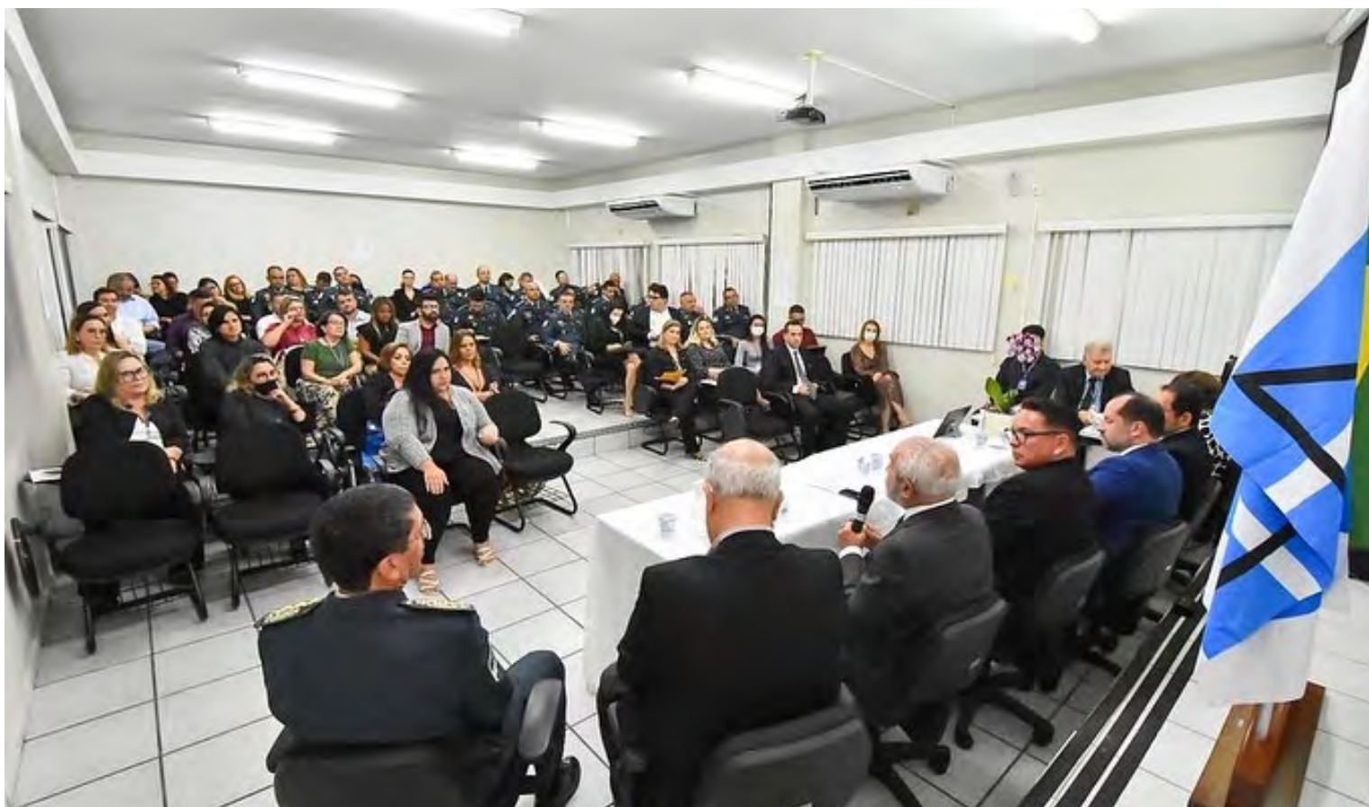
Durante os anos de 2019 a 2022, a Escola da Assembleia abriu 15 turmas de pós-graduação, contemplando 851 alunos

Os conhecimentos adquiridos no curso, são importantes para se entender melhor como todo esse sistema funciona, para que o Gestor consiga identificar possíveis problemas e assim, chegar nas possibilidades de melhorar e desenvolver cada área. Além disso, os conhecimentos adquiridos também são ligados a outras áreas, como: Direito, Economia e Sociologia.