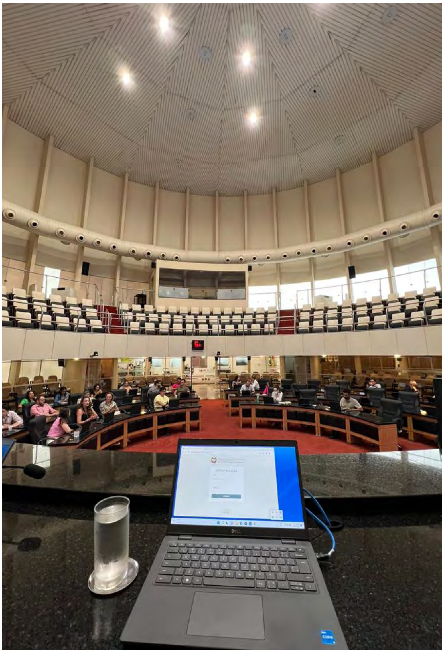
A partir de 1º de fevereiro, os deputados estaduais de SC darão início à nova Legislatura utilizando o projeto desenvolvido pela ALRN

O coordenador explica que a transferência de conhecimento e capacitação está sendo feita tanto para os técnicos da área de Tecnologia quanto para representantes da Diretoria Legislativa, da Coordenadoria das Comissões, da equipe do Plenário e ainda do grupo de trabalho