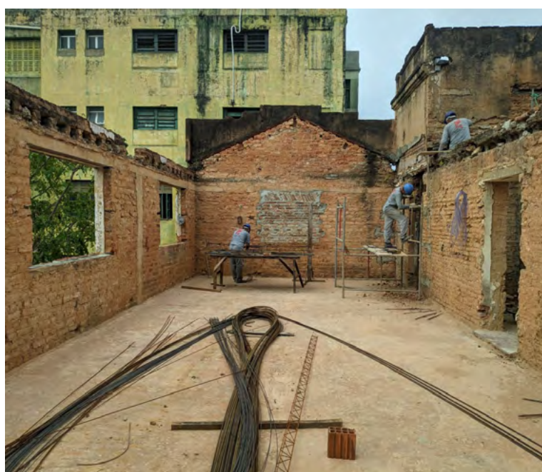
Projeto museográfico moderno e interativo terá área com 550m 2

ATUALMENTE, MEMORIAL ESTÁ INSTALADO NA SEDE DA ALRN; NOVO PRÉDIO FUNCIONARÁ NO SOLAR TAVARES DE LYRA, NO CENTRO