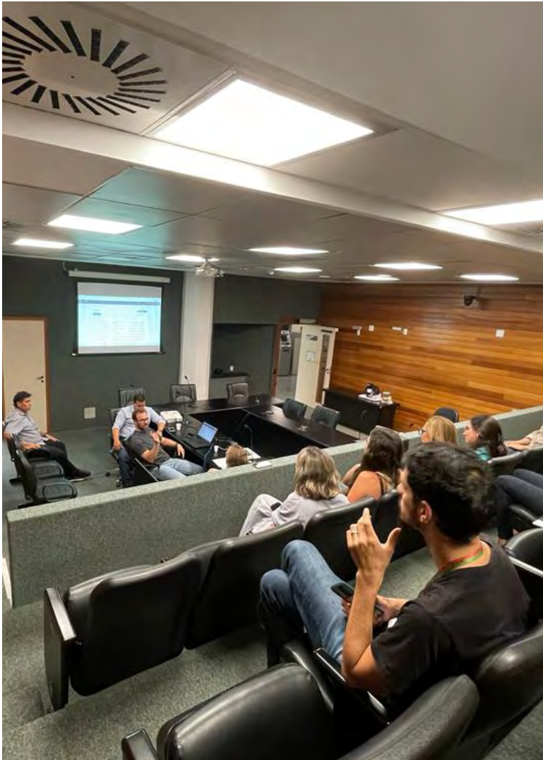
A transferência de conhecimento e capacitação sobre os sistemas está sendo feita , in loco, pelos técnicos da Assembleia Potiguar para os do Legislativo Catarinense