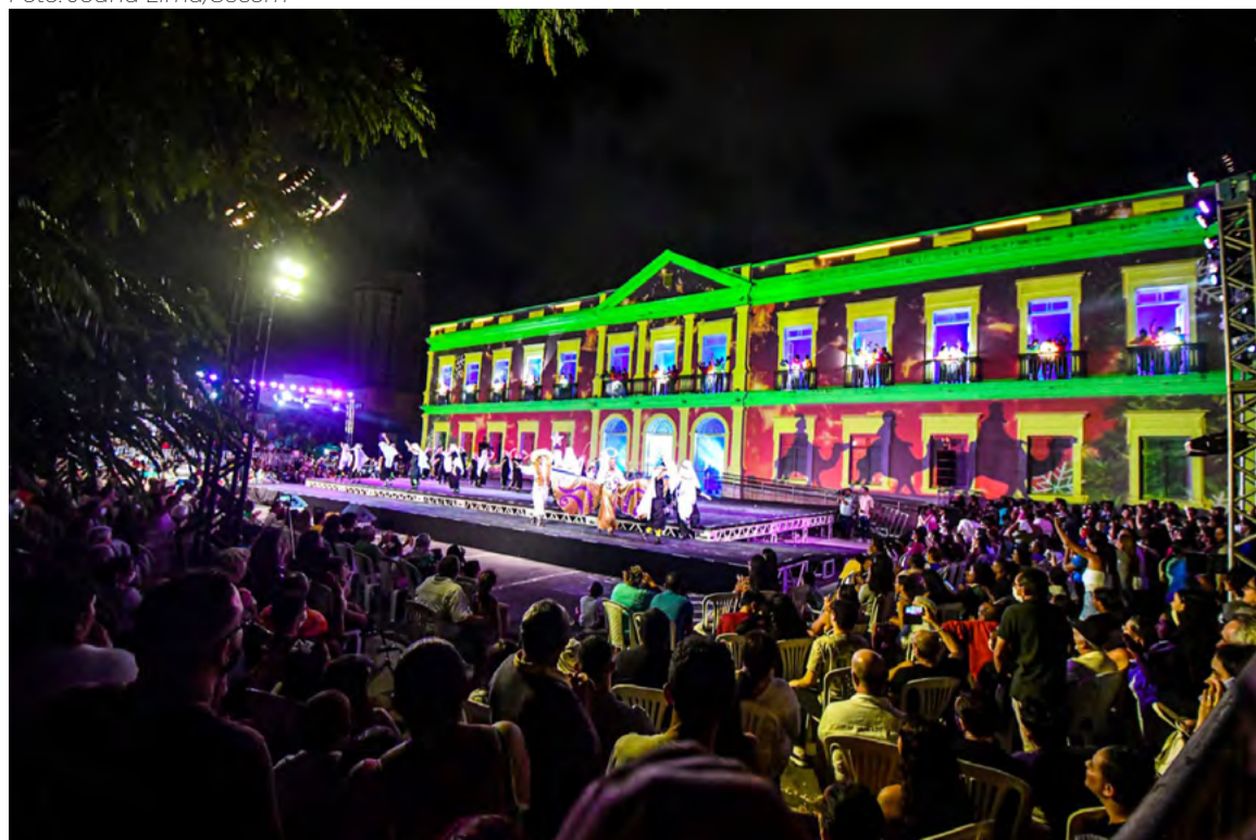
Realizado no último fim de semana, espetáculo Presente de Natal voltou ao Palácio da Cultura