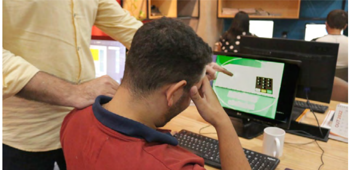
Práticas mais frequentes de assédio foram a dispensa discriminatória do trabalho

As práticas mais frequentes denunciadas ao MPT foram a dispensa discriminatória de trabalhadores em razão de seu voto ou de seu posicionamento político e o assédio para participação em bloqueios das vias públicas ou em atos contra as instituições democráticas, em razão do resultado do pleito eleitoral. O alto número de denúncias retrata os ânimos exaltados e o uso da violência e do assédio como práticas usuais na manipulação ou