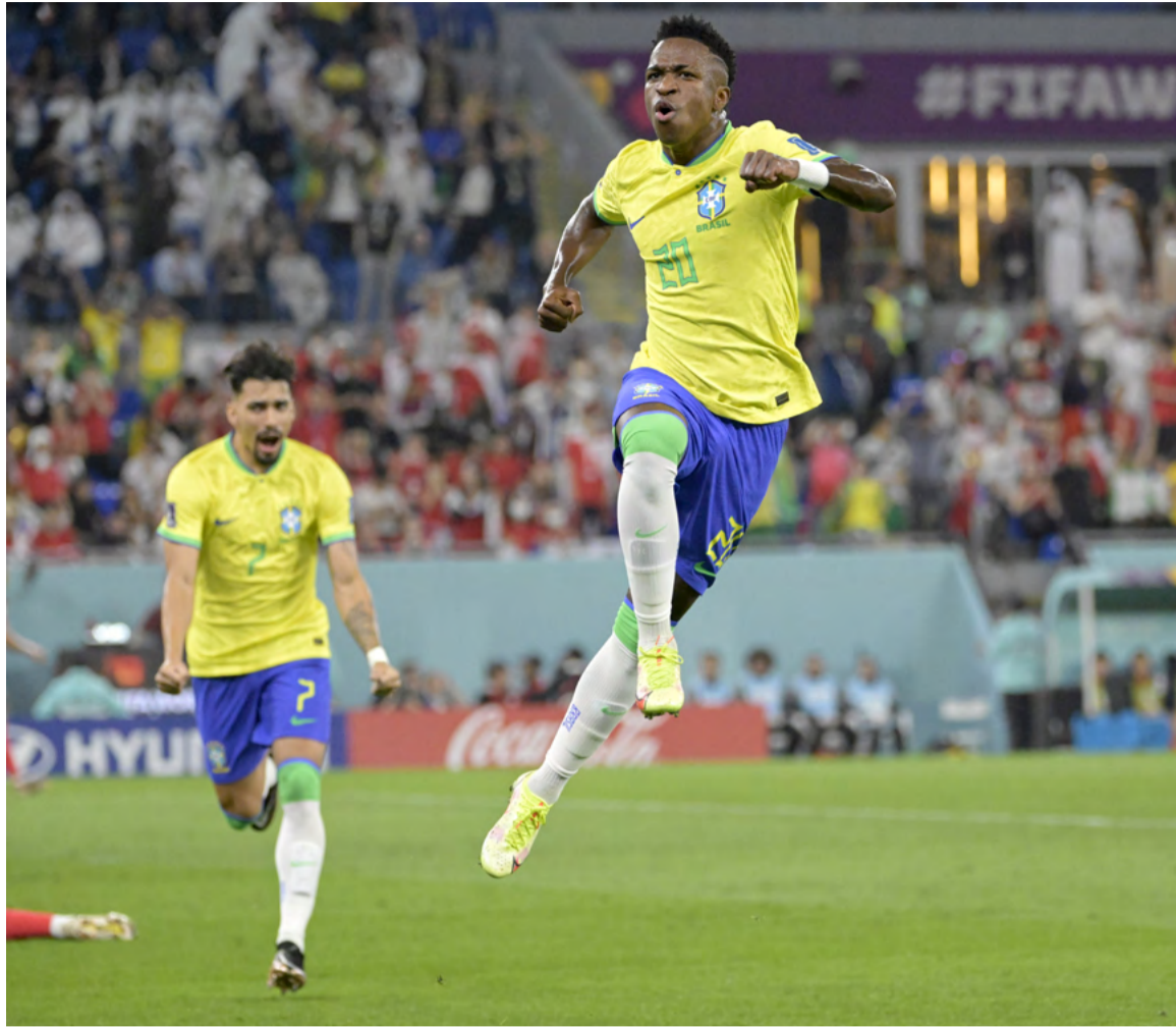
Aos 7 minutos de jogo, Vinícius Júnior abriu o placar e fez seu primeiro gol em Copas