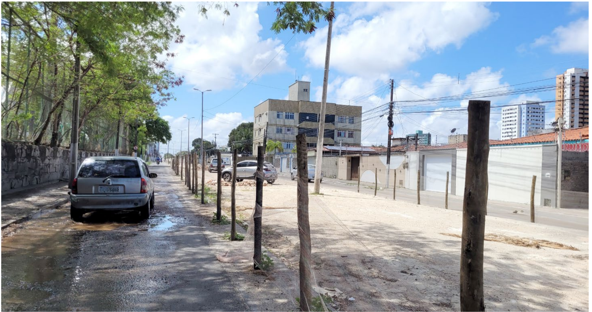
Serviços de macrodrenagem na avenida Jerônimo Câmara, no bairro de Lagoa Nova, conta com 70% de conclusão