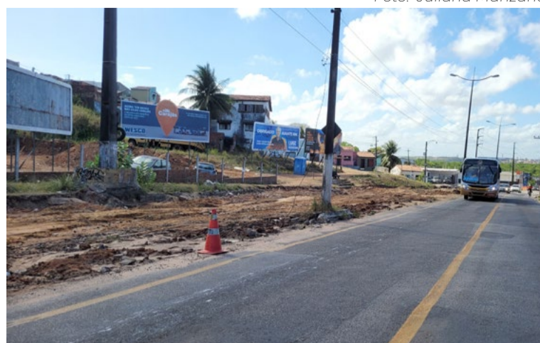
Obra na Felizardo Moura tem previsão de 18 meses

O TOTAL DE TODAS AS OBRAS CHEGA A R$ 392,5 MILHÕES