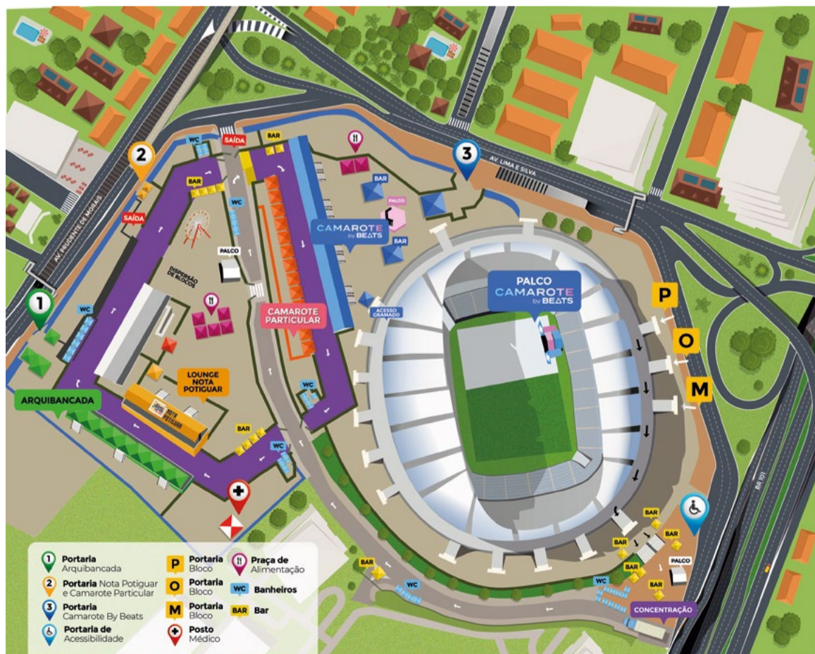
Mapa com definições de locais de camarotes, percursos, arquibancadas e áreas de shows

Já os abadás do Lounge Nota Potiguar serão entregues da quarta (7) até o sábado no Natal Shopping, das 10h às 21h.