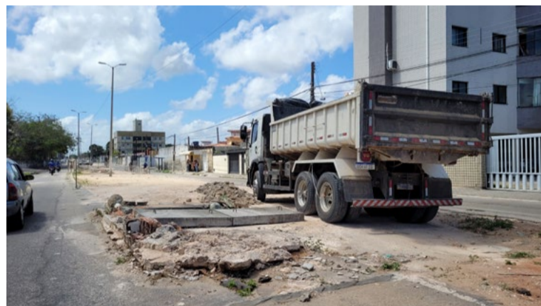
Valor da obra de macrodrenagem é de R$ 211 milhões