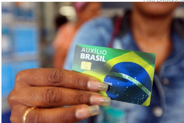
Valor médio pago pelo Auxílio Brasil no RN é de R$ 607

“Quando a gente tem o Auxílio Brasil com maior volume do que carteira assinada, significa dizer que estamos em um contexto não muito adequado, onde a ajuda da União está socorrendo as pessoas que estão em situação de pobreza e miséria. Então, é melhor ter o Auxílio Brasil do que não ter. Mas, quando ele supera o número de trabalhadores com carteira assinada, significa que a situação econômica do RN não é das melhores. Como o valor pago no Auxílio Brasil (em média R$ 607,01) é menor que o salário mínimo (R$ 1.212), isso implica em