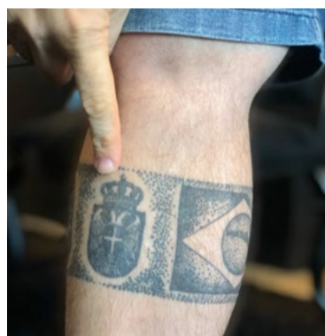
Camisas da sérvia espalhadas, a do Brasil no peito e, no corpo, países que marcam sua vida