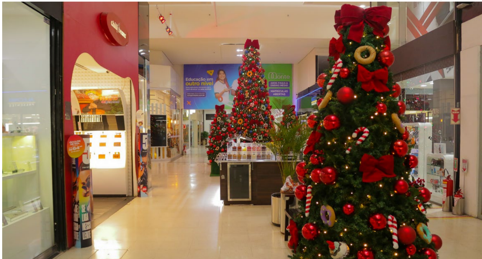
Inspirada no mundo dos doces, decoração do Praia Shopping foi lançada com investimento maior que em 2020 e 2021

"Preparamos uma decoração linda, um evento grandioso e especial para a chegada do Papai Noel, que é o momento mais bonito da festa. Nossa decoração proporcionará experiências inesquecíveis e os nossos clientes irão