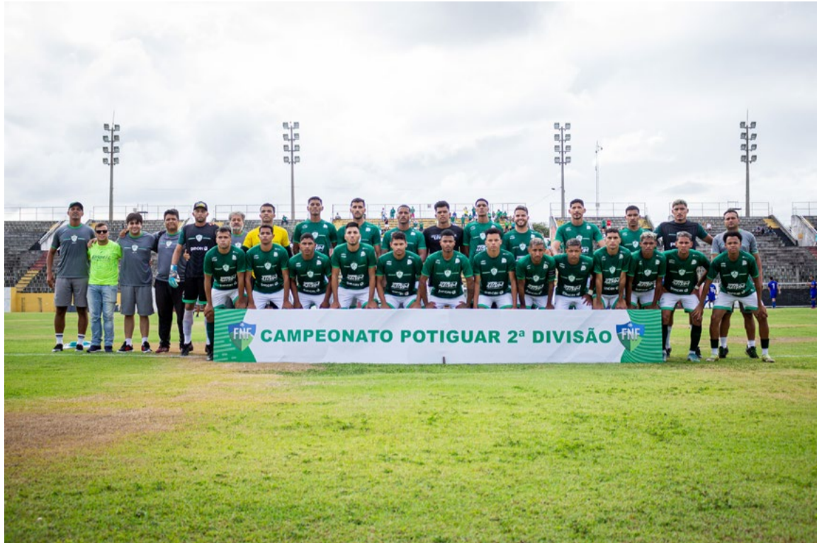
Alviverde estava fora da primeira divisão estadual há cinco anos e agora retorna à elite