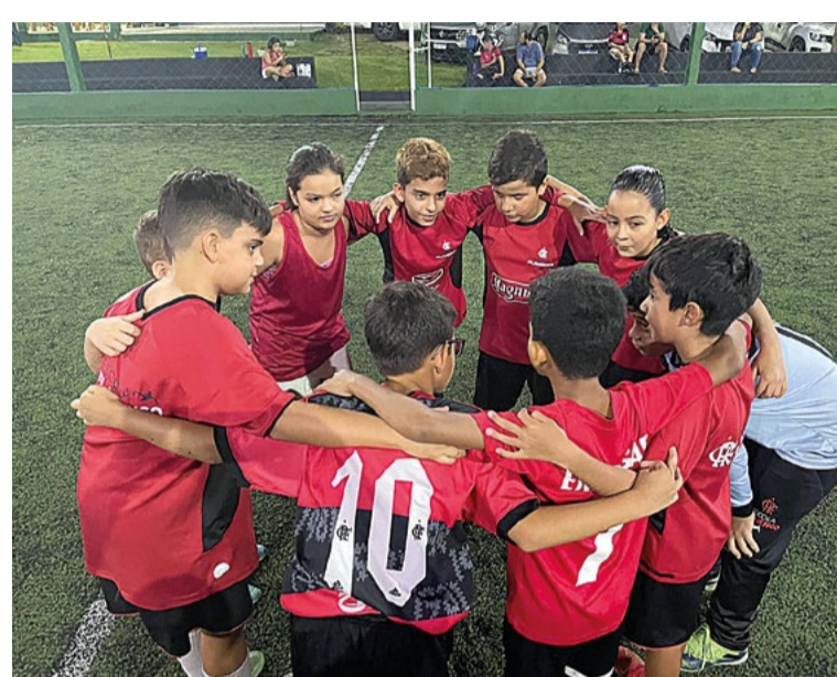
Bom desempenho pode levar atletas ao Flamengo/RJ

aos nossos alunos. Um deles, que acho o mais interessante, é a oportunidade aos alunos da escola, através de um projeto chamado “peneira”, onde inscrevemos o aluno que tem um bom desempenho e levamos pra o Flamengo para fazer o teste”, explicou Auxiliadora, uma das coordenadoras