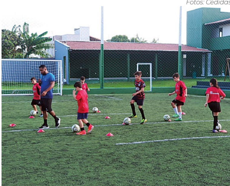
Em Parnamirim, a escolinha atende cerca de 83 alunos

Em Parnamirim, a escolinha do Flamengo atende cerca de 83 alunos dos 4 aos 17 anos de idade, que pagam uma mensalidade entre R$ 130 a 180, valor que cobre a despesa do material utilizado nas aulas, manutenção do quadro de colaboradores e custos do espaço de treinamento. As aulas acontecem nas segundas, terças,