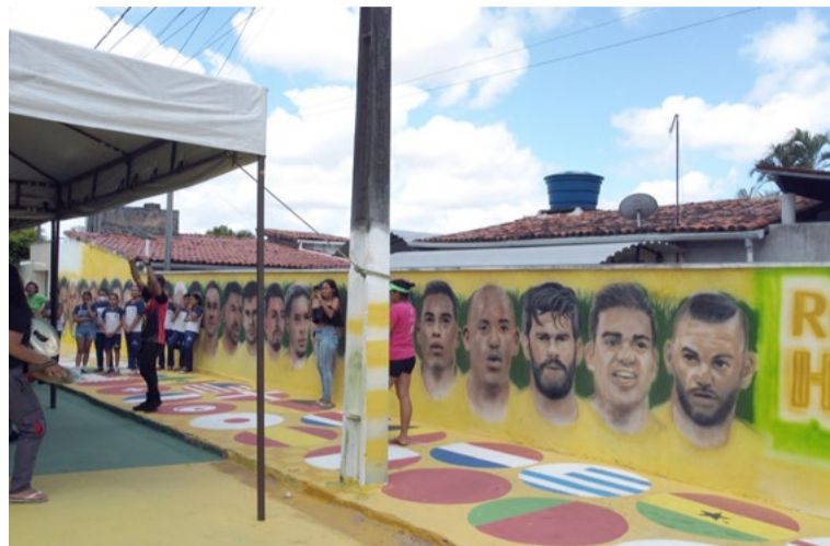
Decoração com bandeiras, taça e jogadores chamam a atenção de quem passa por Macaíba