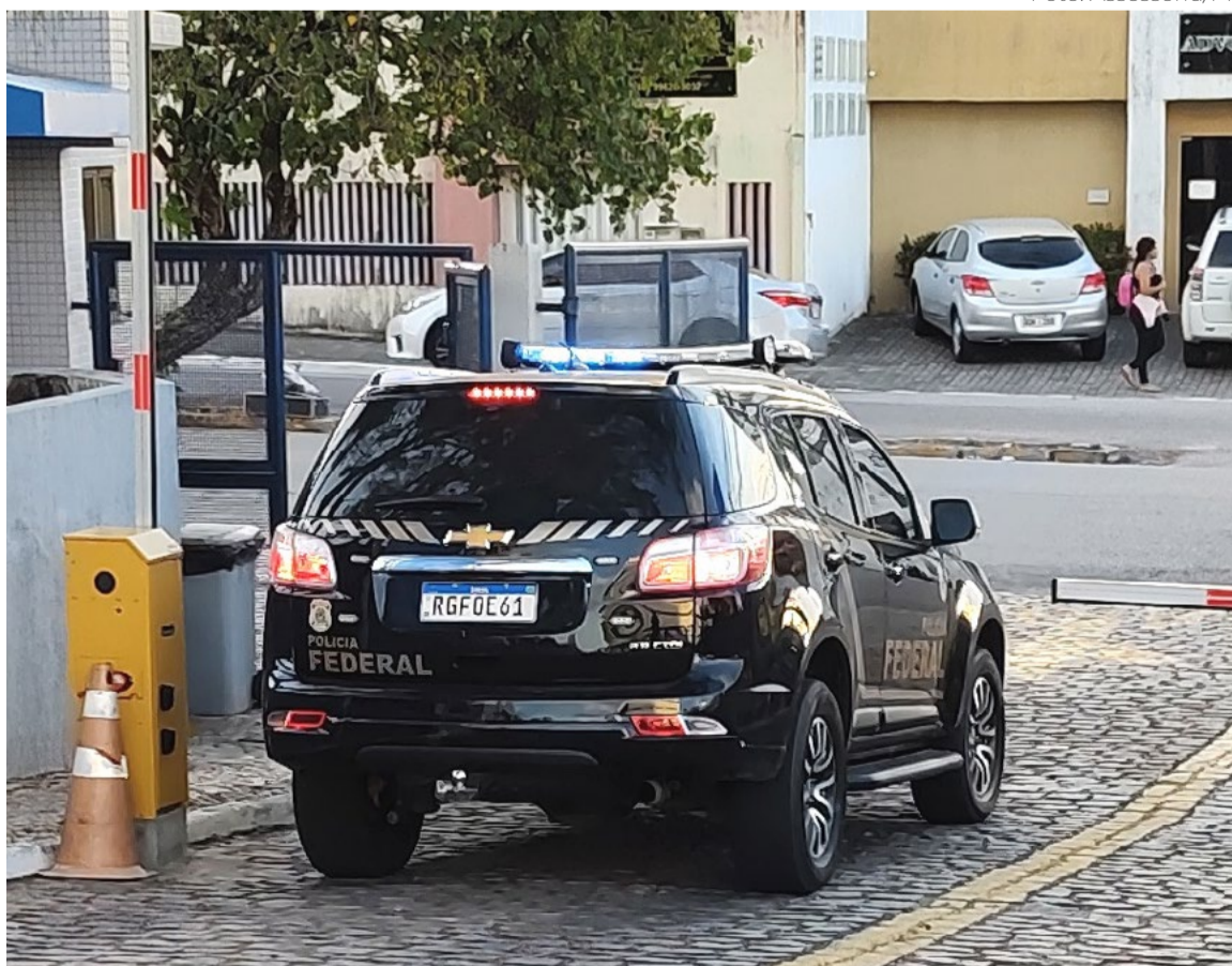
Ações da Operação Guardiões da Polícia Federal da Infância tiveram início em agosto

“O combate ao abuso sexual infantil é uma prioridade na Polícia Federal, com um trabalho amplo e complexo, tendo uma Unidade especializada no tema, o Serviço de Repressão a Crimes de Ódio e Pornografia Infantil. Iniciativas como a Operação Guardiões da Infância têm identificado e impedido a ação de centenas de abusadores e o resgate de um número relevante de crianças vítimas”, informou.