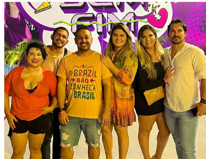
Este colunista com uma turma super querida no Mari Sem Fim em Natal