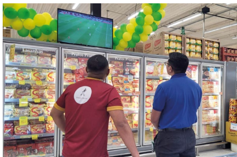
Escala de trabalho deve ser decidida pelo empregador