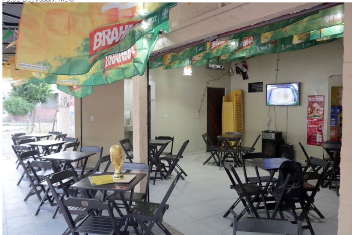
Bar inspirado no futebol investiu em tvs e telões para atrair clientes durante o Mundial