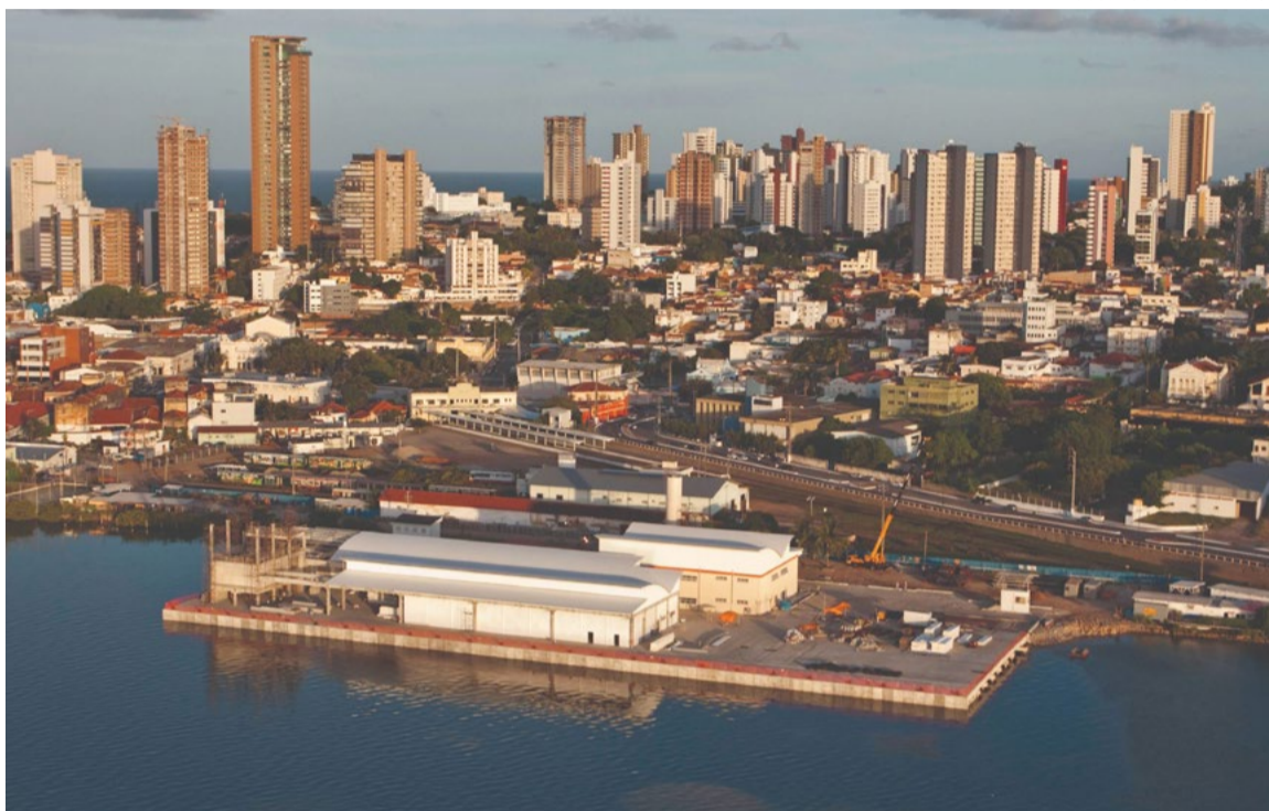
Lance mínimo do leilão do Terminal Pesqueiro de Natal será de apenas R$ 1

De acordo com o Ministério da Economia, os estudos para a concessão foram revisados para o terminal pesqueiro potiguar, chegando-se a condições que poderão ser mais atrativas para os futuros interessados. Prevê-se a publicação do novo edital no