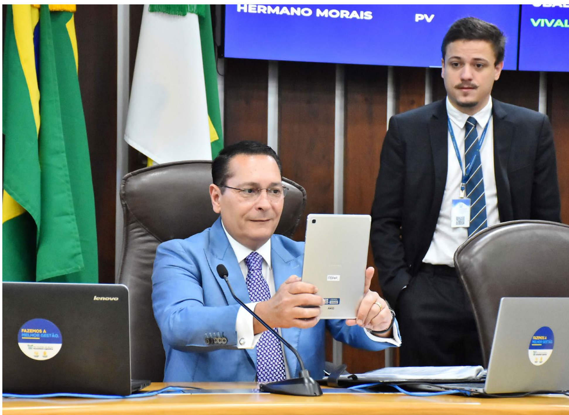
Com ferramentas específicas e disponibilizando informações e proposições da pauta do legislativo estadual, Sistema Legis Plenário foi desenvolvido pela Diretoria de Gestão Tecnológica da Casa