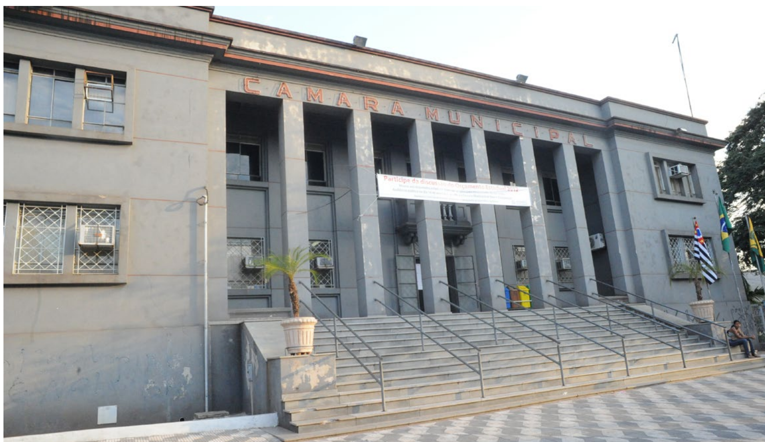
Camara Municipal Bauru terá o sistema de gerenciamento e exibição de vídeos de todas as atividades legislativas

O Legis Vídeos, sistema voltado para o gerenciamento e a exibição de vídeos das atividades legislativas e criado pela Diretoria de Gestão Tecnológica da Assembleia Legislativa do Rio Grande do Norte, já está funcionando na Câmara Municipal de Bauru (SP). Todas as etapas para o funcionamento do sistema foram cumpridas em pouco mais de três meses, logo após a assinatura do Termo de Cooperação Técnica entre as casas legislativas. Sem custo de implantação, suporte e treinamento, a plataforma digital está disponível para toda a