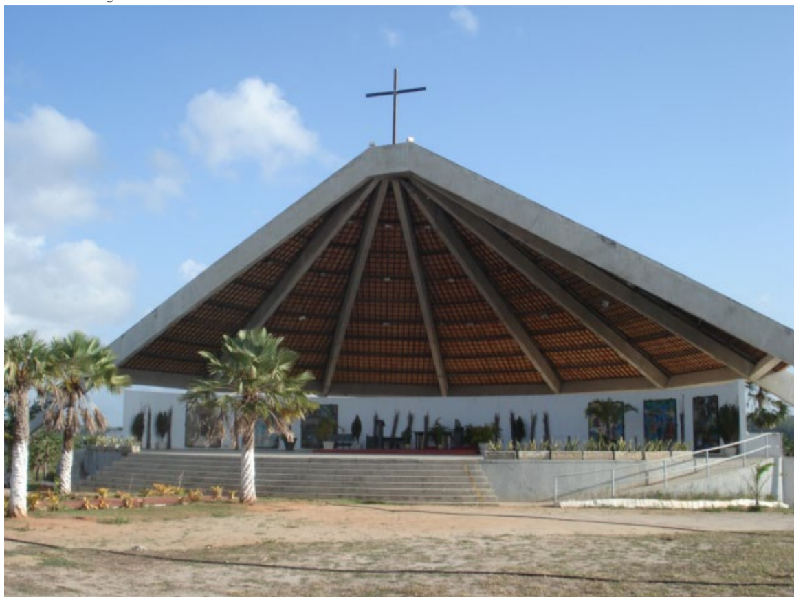
Santuário dos Santos Mártires fica no município de São Gonçalo do Amarante