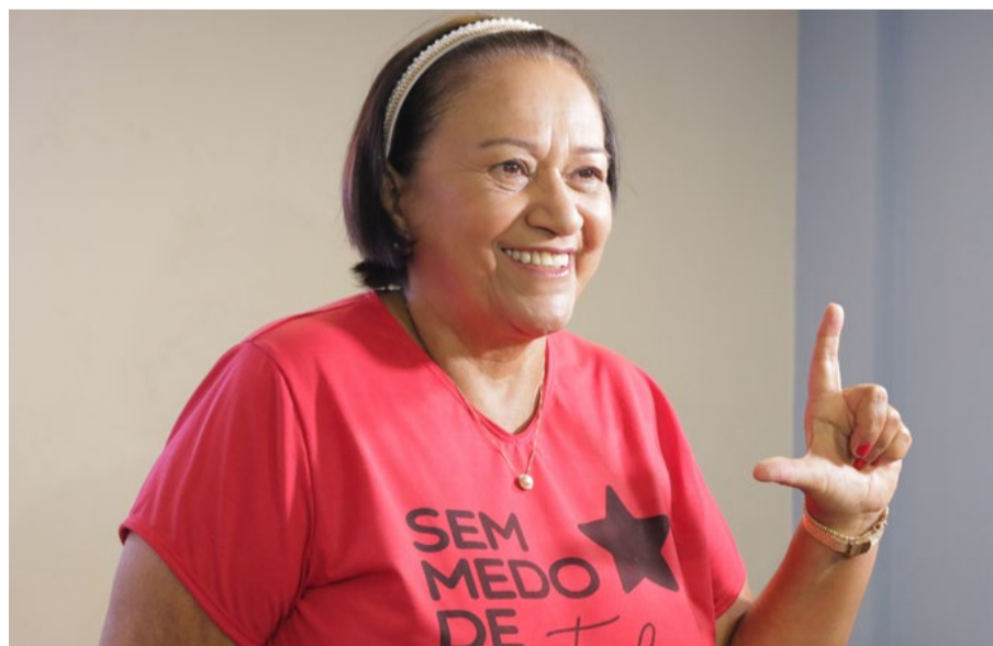
Governadora Fátima Bezerra (PT) terá maior oposição na Câmara

“Quando olhamos para deputado federal, a esquerda só elege dois. A gente percebe que o voto tem muita desconexão do viés ideológico no sentido do que é o voto para governador e para presidente, se olharmos o voto para senador e proporcionais”, explica Thiago Medeiros que completa: “A esquerda conseguiu uma expressiva votação para Lula e para a governadora no Estado do