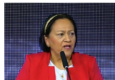
FÁTIMA BEZERRA (PT) VOTAÇÃO: 1.066.496