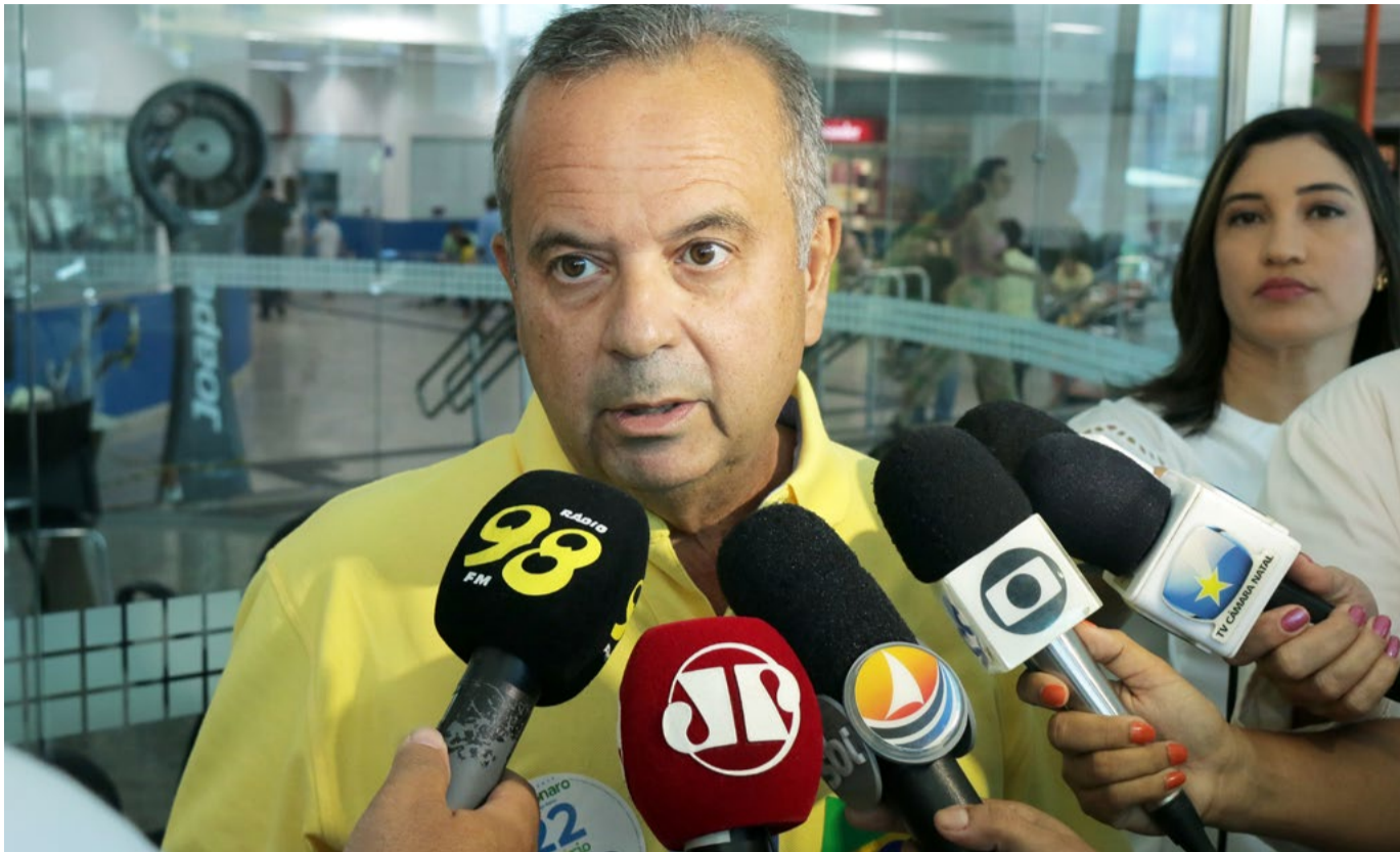
Vitória de Rogério Marinho (PL) ao Senado vai fortalecer o bolsonarismo no Rio Grande do Norte