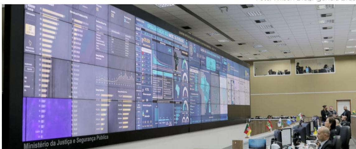
Sede do Tribunal Superior Eleitoral prepara o segundo para o próximo dia 30 de outubro

Para o presidente Bolsonaro, que vai apostar na melhoria dos índices econômicos para