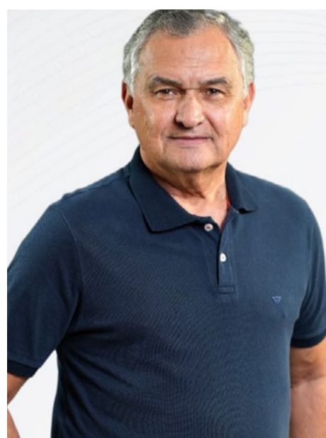
GENERAL GIRÃO (PL) VOTAÇÃO: 76.698