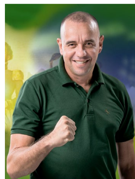
GONÇALVES (PL) VOTAÇÃO: 56.315