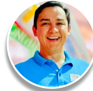
NEILTON (PL) VOTAÇÃO: 25.143