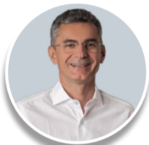
FRANCISDO DO PT (PT) VOTAÇÃO: 50.499