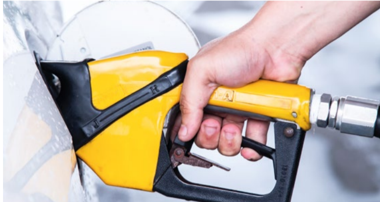
Distribuidoras alegam defasagem de preço e corte de pedidos

pria Petrobras não aumente seu ritmo de importação.