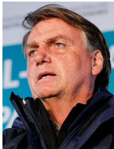
Presidente Jair Bolsonaro

lançamento do programa 'Internet Brasil', do Ministério das Comunicações. Na ocasião, Bolsonaro também fará outras entregas do Ministério das Comunicações e da Fundação Nacional de Saúde (Funasa). A programação está marcada para ocorrer durante a manhã, na praça Mãe Peregrina, no bairro Pitimbu, zona Sul de Natal.