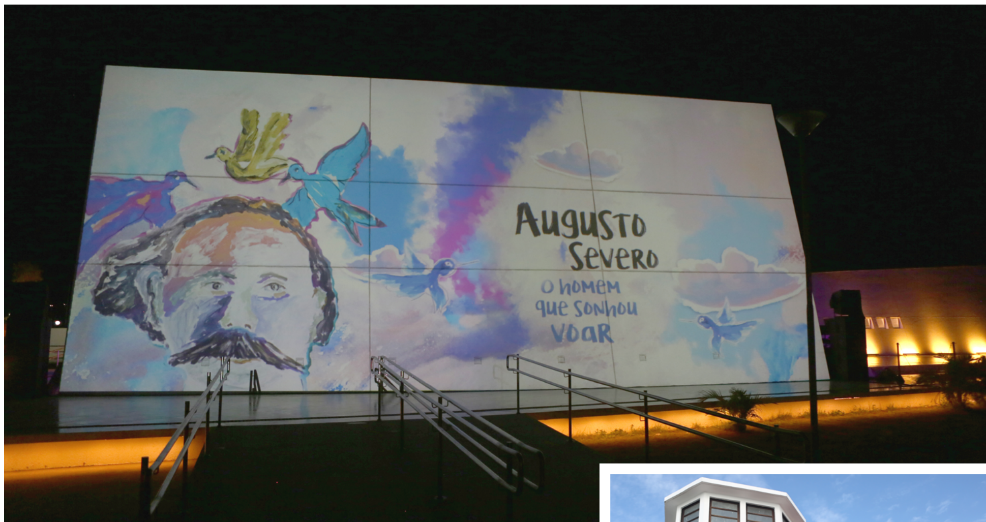
Projeção mapeada coloriu a fachada do Memorial do Aviador, no Complexo Cultural da Rampa