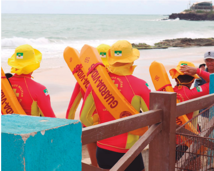
Hoje existem nove pontos-base do Corpo de Bombeiros no litoral do RN

e o contrato foi rescindido, sendo convocada a segunda construtora colocada.