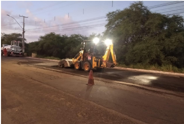
Equipes do DER-RN realizam primeiros serviços de recuperação da via

As obras do Programa de Restauração de Trechos Críticos estão beneficiando rodovias estaduais em todas as regiões do estado. As mais adiantadas são a recuperação da RN-078, no trecho entre a BR-226 e a divisa com a Paraíba, um trecho de 9,6 km, onde