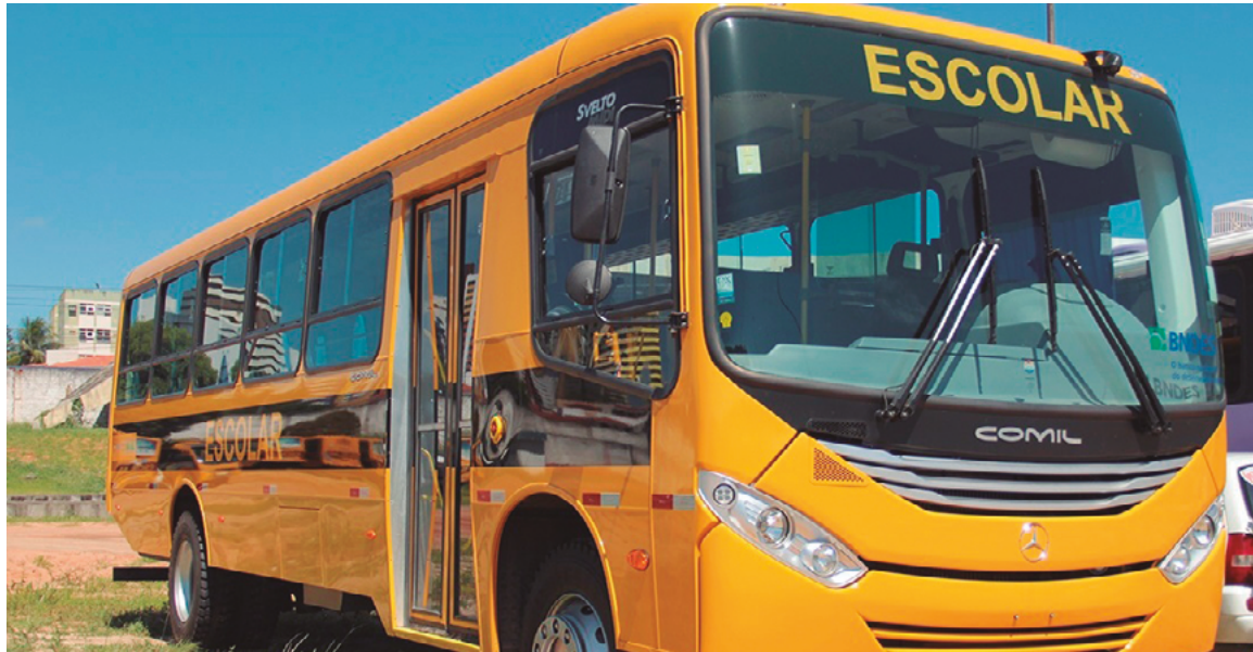
Ampliação do repasse beneficia estudantes de toda a rede pública de ensino do Rio Grande do Norte

Educação, da Cultura, do Esporte e do Lazer.