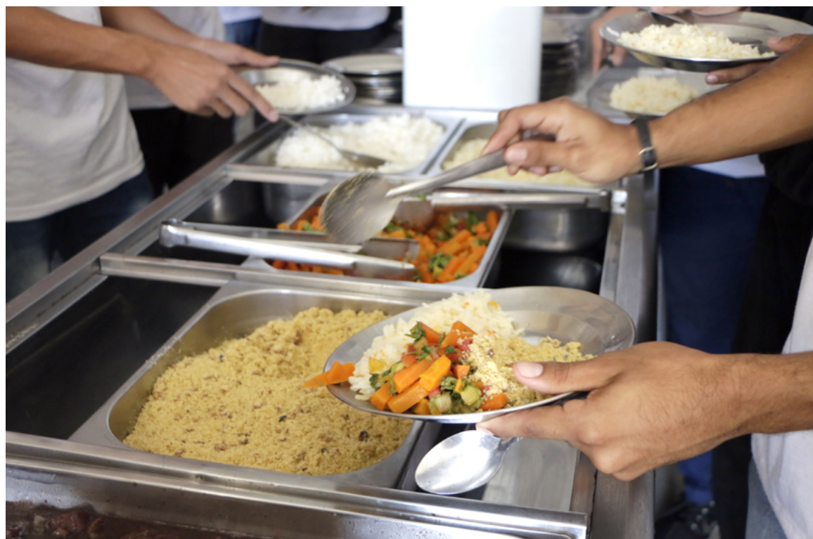
Estado tem garantido que nenhum estudante fique sem alimentação e tem apoiado a agricultura familiar

tir que essas famílias se mantivessem no campo.