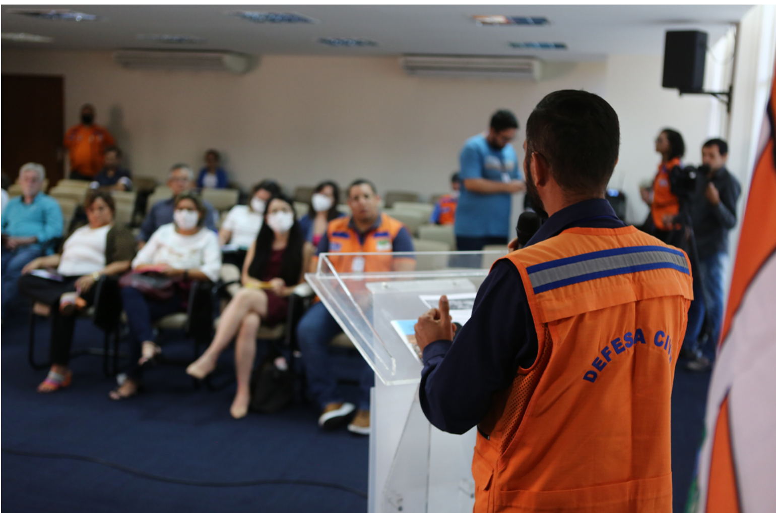
Participantes foram apresentados à ferramenta de autoavaliação de capacidades de resiliência e planejamento de ações de redução de riscos da MCR2030