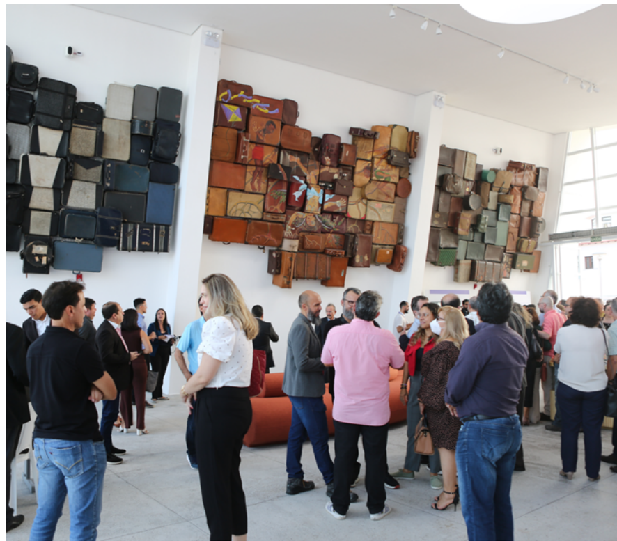
Convidados puderam ver detalhes da ambientação das novas instalações da Rampa