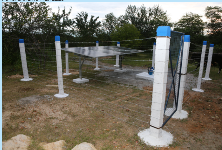
Ao todo serão viabilizados 120 poços tubulares em comunidades rurais

das áreas urbanas e beneficiando quem mais precisa”.