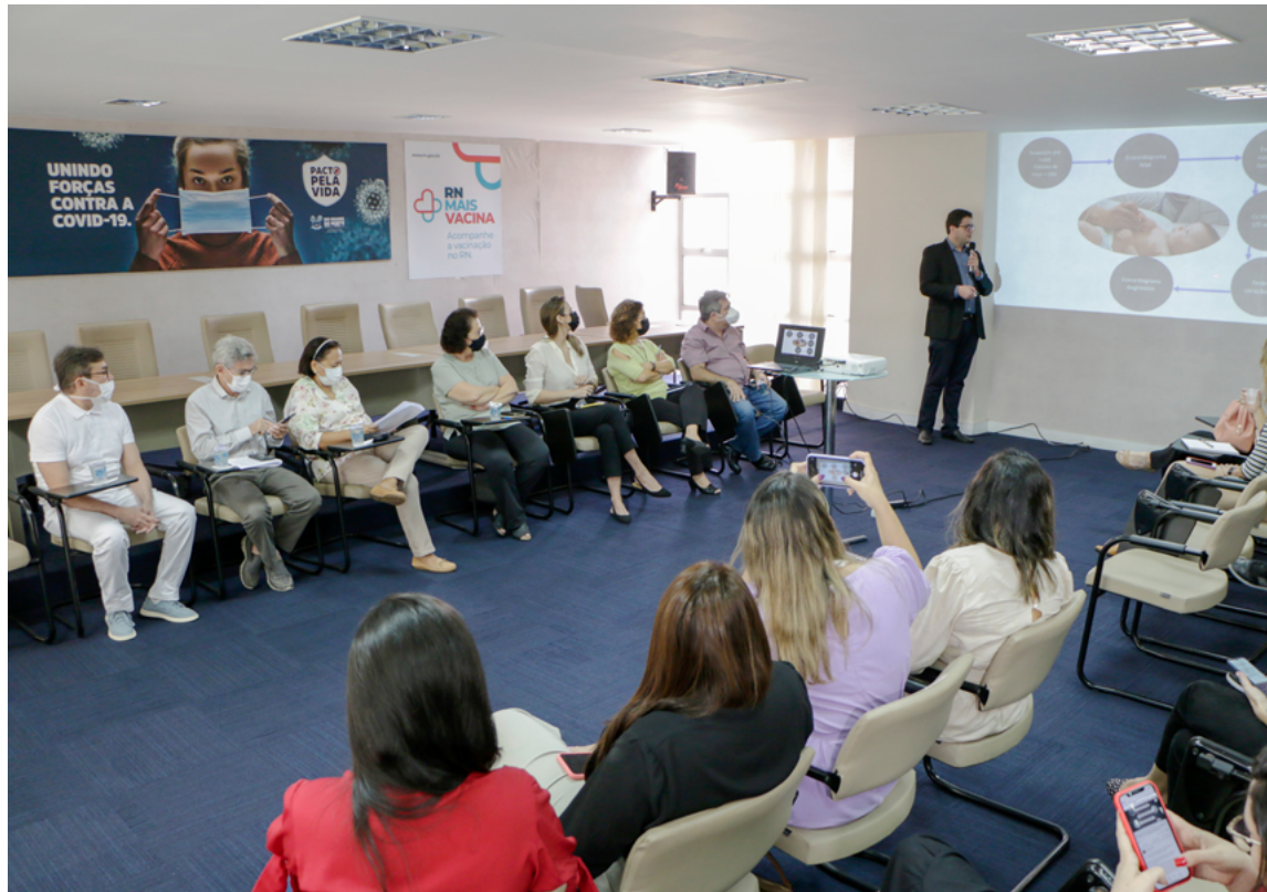
Proposta é estruturar plano de consultoria e educação continuada para equipes com ações de detecção precoce

"O RN+Coração tem um valor humano incalculável, que abrange o trabalho de capacitação para que os servidores estejam aptos a identificar os problemas e trazer a cura para as crianças. O que se vê nas estatísticas é que as cardiopatias, quando detectadas a tempo, são superáveis e nossa proposta é salvar vidas. Para o Governo, a parceria com a Amico é uma felicidade, pois é uma associação reconhecida em todo o país", ressaltou a governadora Fátima Bezerra, que lembrou de sua mãe, parteira que trouxe ao mundo cente-