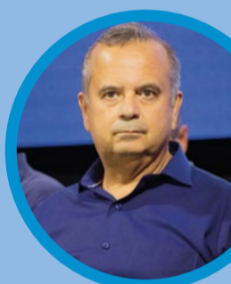
PL 58 anos Natal/RN Economista

Foi vereador e deputado federal por três mandatos, além de também ter sido secretário de Desenvolvimento Econômico do Rio Grande do Norte durante a gestão da ex-governadora Rosalba Ciarlini. Foi um dos principais responsáveis pela Reforma Trabalhista, que o fez ganhar a simpatia dos empresários e a rejeição dos trabalhadores, e da Reforma da Previdência. Não conseguiu ser reeleito em 2018 e, em dezembro do mesmo ano, foi anunciado como secretário especial da Previdência Social e Trabalho no Governo Bolsonaro. Em fevereiro de 2020 assumiu o Ministério do Desenvolvimento Regional, deixando o cargo em março deste ano para se candidatar ao Senado. Em sua gestão ganhou repercussão um suposto esquema de superfaturamento de tratores pela estatal Codevasf. A investigação, porém, ainda não saiu do papel.