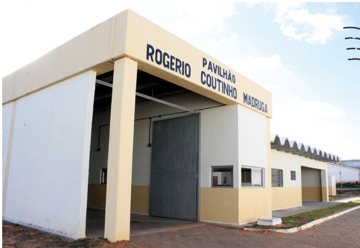
Advogada tentou bular o sistema de segurança da Secretaria da Administração Penitenciária

Com os estabelecimentos prisionais sob controle da Secretaria da Administração Penitenciária (Seap), as comunicações entre os criminosos foram dificultadas, como revela uma das mensagens apreendidas: “Agora nossas cadeias não têm telefone, mas antes tinha com força”. Sem energia nas celas, e com o uso de tecnologia como o scanner corporal de raios-x, entrar com um celular numa cadeia ficou extremamente difícil. Os criminosos, então, tentam usar outros artifícios para se comunicar. Desde 2019, quando um preso engoliu um celular com o objetivo de escondê-lo no presídio, que não há