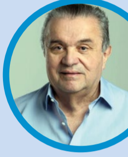
BRASIL 35 77 anos Natal/RN Professor, advogado, jornalista