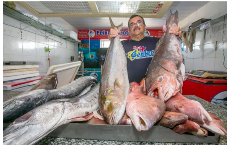
Em Natal, 76% dos consumidores pretendem comprar peixe