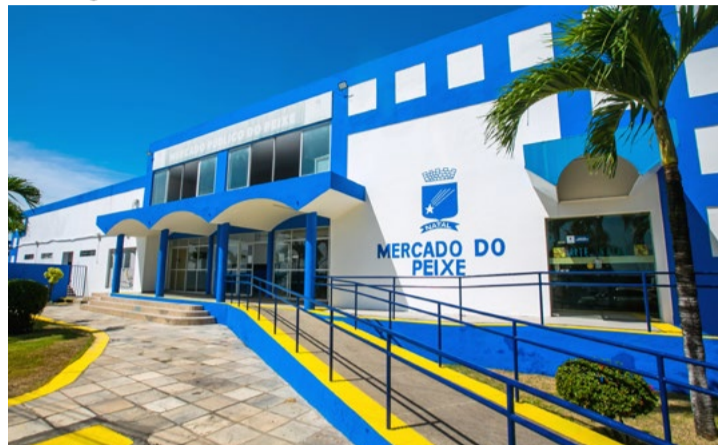
Movimento aumenta no Mercado do Peixe, nas Rocas

senta um aumento de 6% com relação ao ano passado, que foi R$ 92,15. Já os consumidores mossoroenses pretendem gastar uma média de R$ 87,65 - valor 2% menor do que o registrado no ano passado (R$ 89,40).