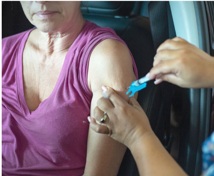
Governo do RN já iniciou campanha para 4ª dose em idosos

H3N2, incluindo a cepa Darwin, e o tipo B. A formulação é constantemente atualizada para que a dose seja efetiva na proteção contra as novas cepas do vírus. Historicamente, o período de sazonalidade das doenças respiratórias, no qual se registra um maior número de ocorrências, é observado entre os meses de março e junho.