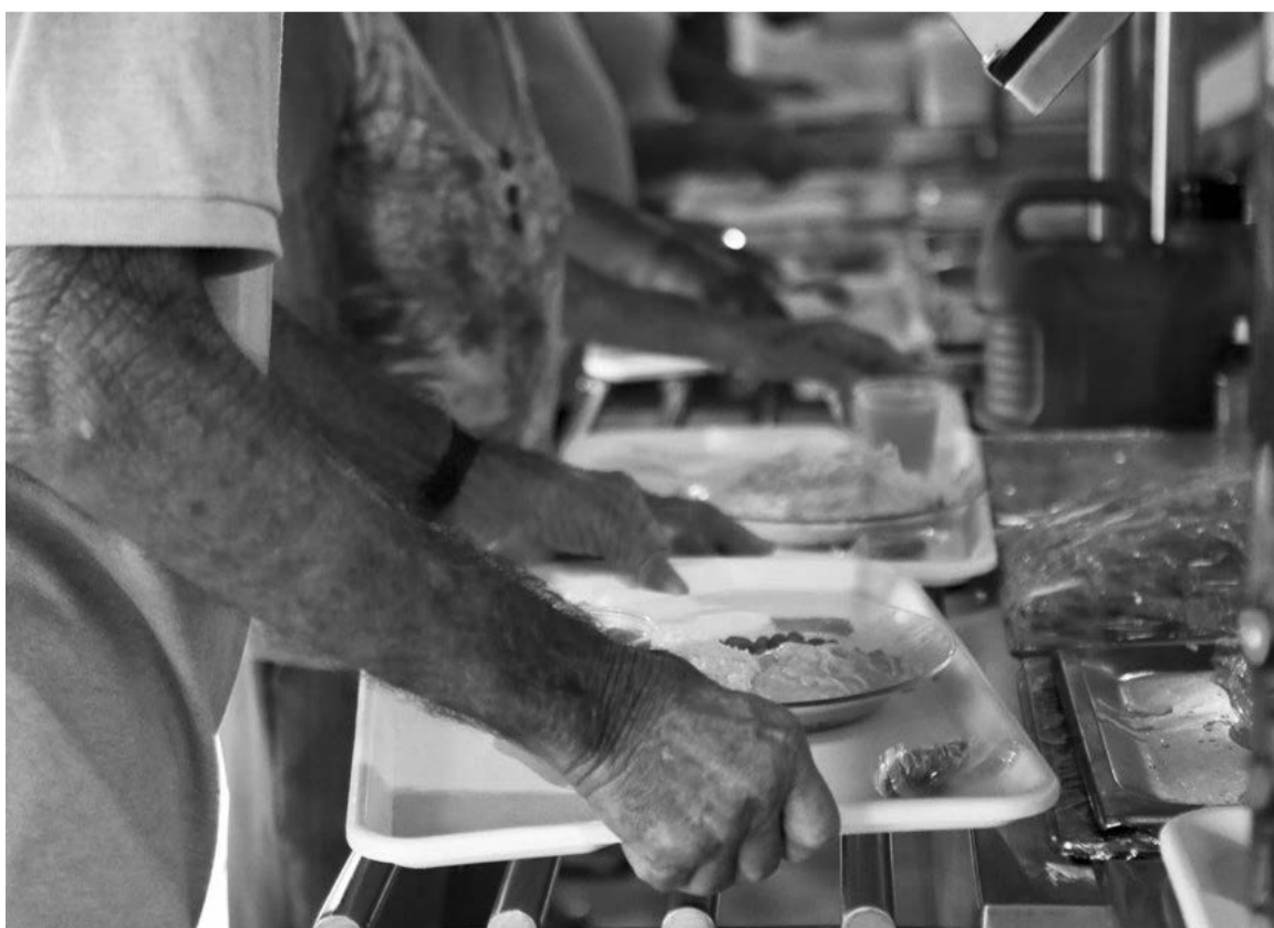
Público-alvo dos restaurantes populares são trabalhadores de baixa-renda e pessoas em situação de pobreza e extrema