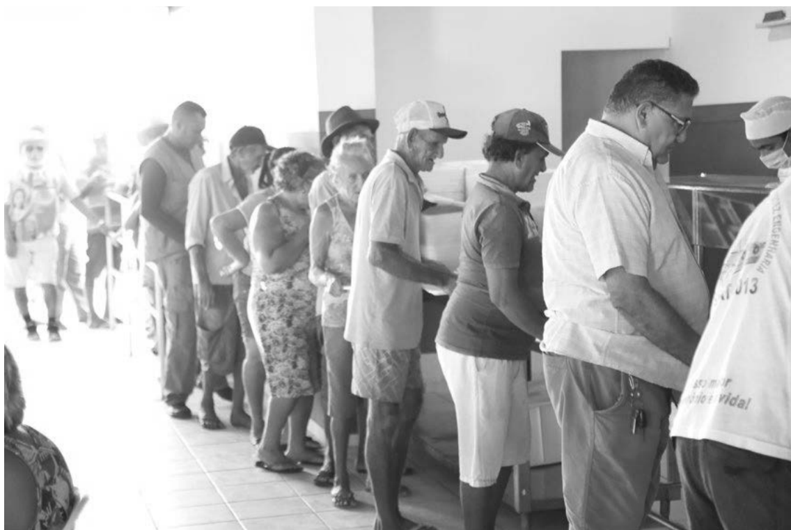
A isenção da taxa nas refeições chega a mais de duas mil pessoas do público-alvo dos restaurantes populares