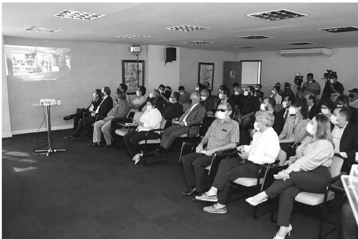
Solenidade de prestação de contas do Governo reuniu secretários e imprensa no auditório da Governadoria

dos do Brasil no uso da ciência para o combate à pandemia da covid-19.