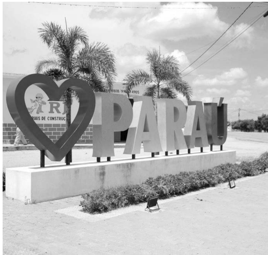
Município de Paraú será um dos beneficiados com a restauração da RN-233