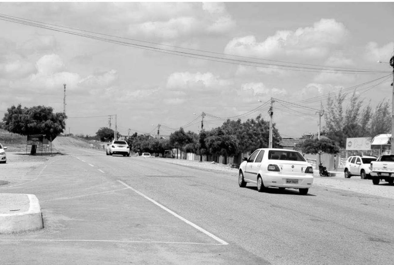
Recuperação da rodovia levará mais desenvolvimento ao Médio e Alto Oeste, como escoamento da produção da região