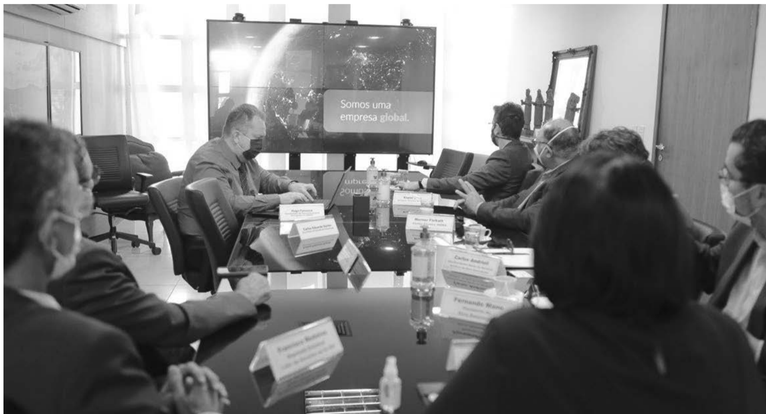
Projeto do Complexo Seridó prevê uma geração de 247 MW, através da instalação de usinas de alta tecnologia da Vestas, com a qual já foi firmado contrato

tores, entre eles os de energia e infraestrutura. No Brasil desde 1989, a empresa possui negócios em 20 estados, de norte a sul do país, com R$ 137 bilhões em ativos. A Elera Renováveis está focada nos investimentos em energias renováveis da Brookfield, que representam R$ 22 bilhões em investimentos e 1,9 GW em capacidade instalada no território nacional.