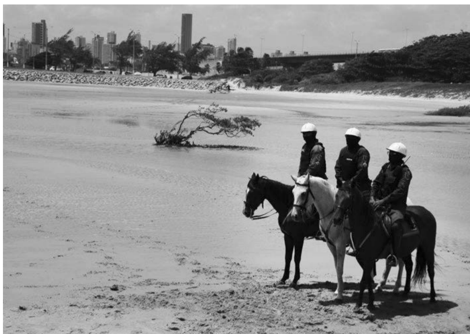
Investimentos darão ainda mais estrutura e melhores condições de trabalho para policiais