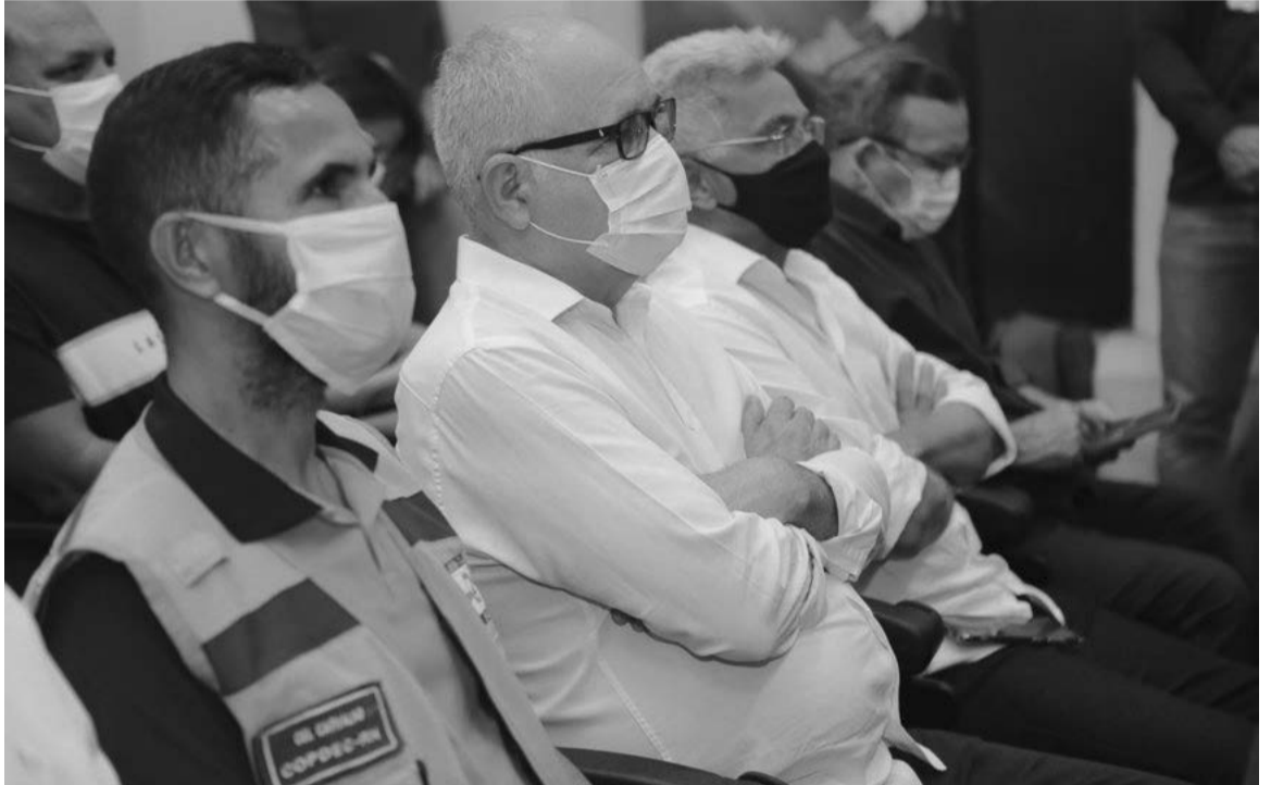
Equipe do Governo participou do lançamento do Plano, realizado no Cinema Teatro Pedro Amorim, em Assu