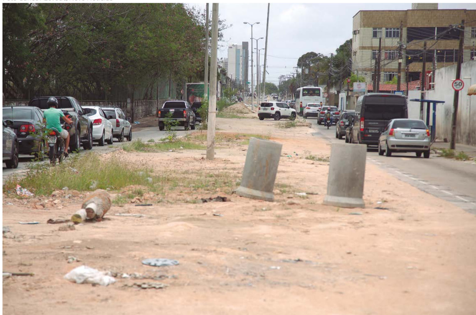
Motoristas se arriscam entre buracos e lixo; outros mais ousados passam pelo meio da obra, onde antes haviam tapumes