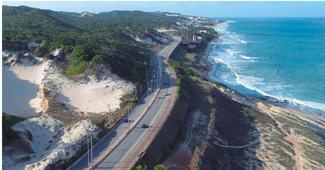
Curvas sinuosas e falta de acostamento adequado são características da rodovia

A via expressa e litorânea de aproximadamente 10 km de extensão, que faz a ligação entre as zonas sul e leste de Natal, capital do Estado do Rio Grande do Norte, é conhecida por suas curvas sinuosas e falta de acostamento suficiente. De acordo com os dados do CPRE enviados ao NOVO Notícias, os acidentes registrados com vítimas lesionadas