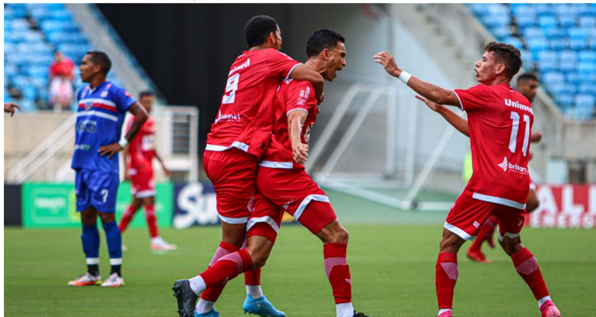
América venceu a equipe do Potyguar de Currais Novos por 2 a 0, na Arena das Dunas