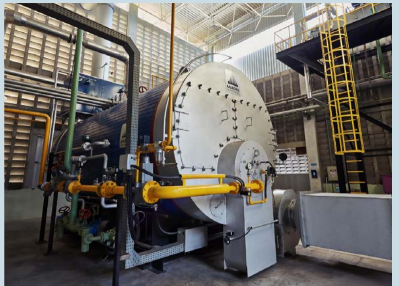
Medida do Governo simplifica o acesso ao benefício por parte das indústrias