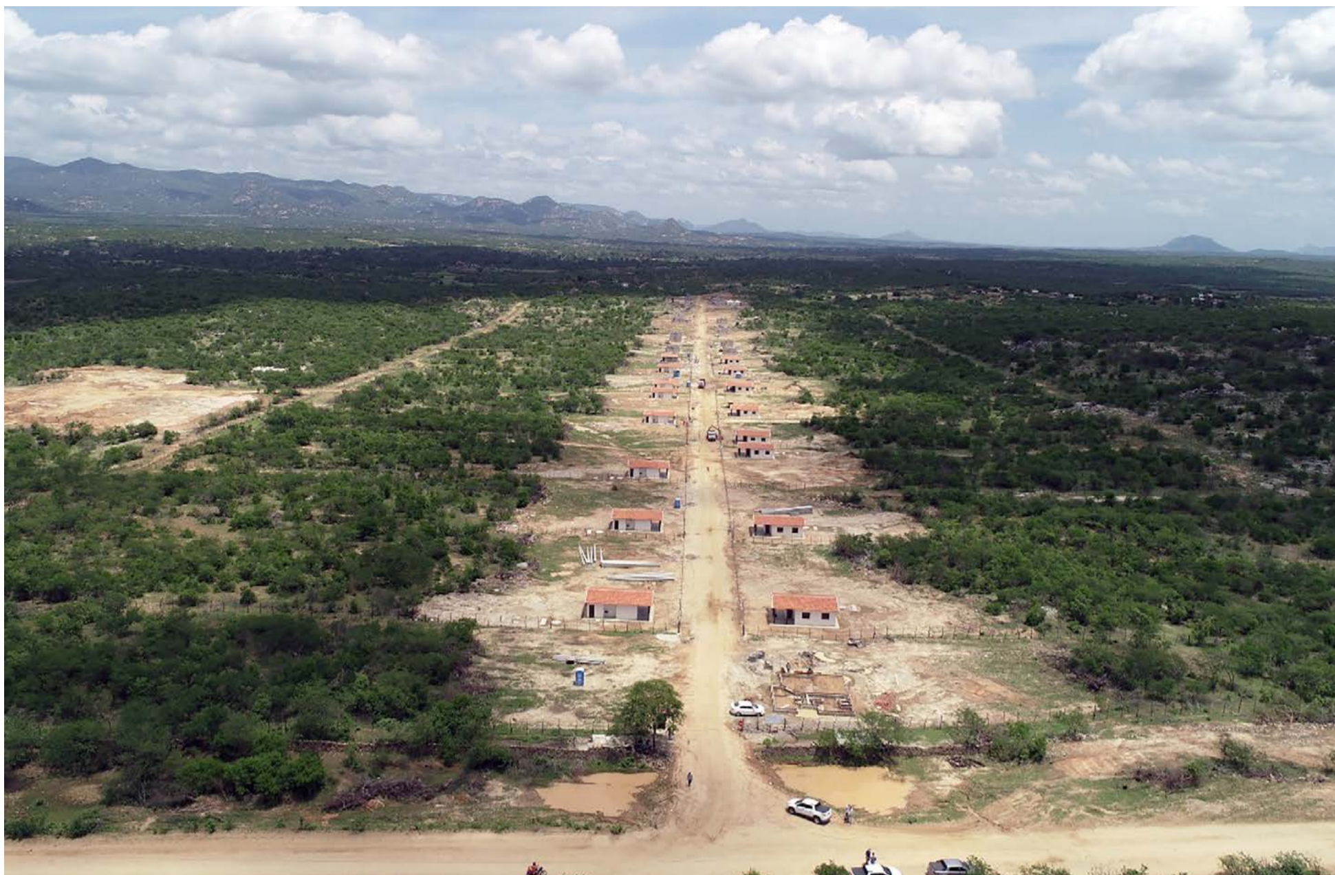
Vista aérea da Agrovila Jucurutu, onde o Governo do RN deu início à relocação de famílias que vivem em áreas inundáveis Barragem Oiticica, principal obra hídrica do Rio Grande do Norte