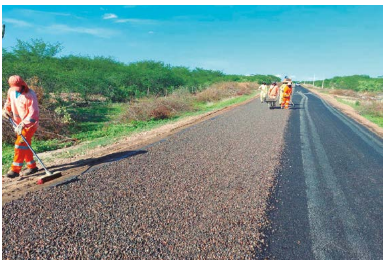
Novo acesso ao distrito de Boi Selado impulsionará desenvolvimento da região