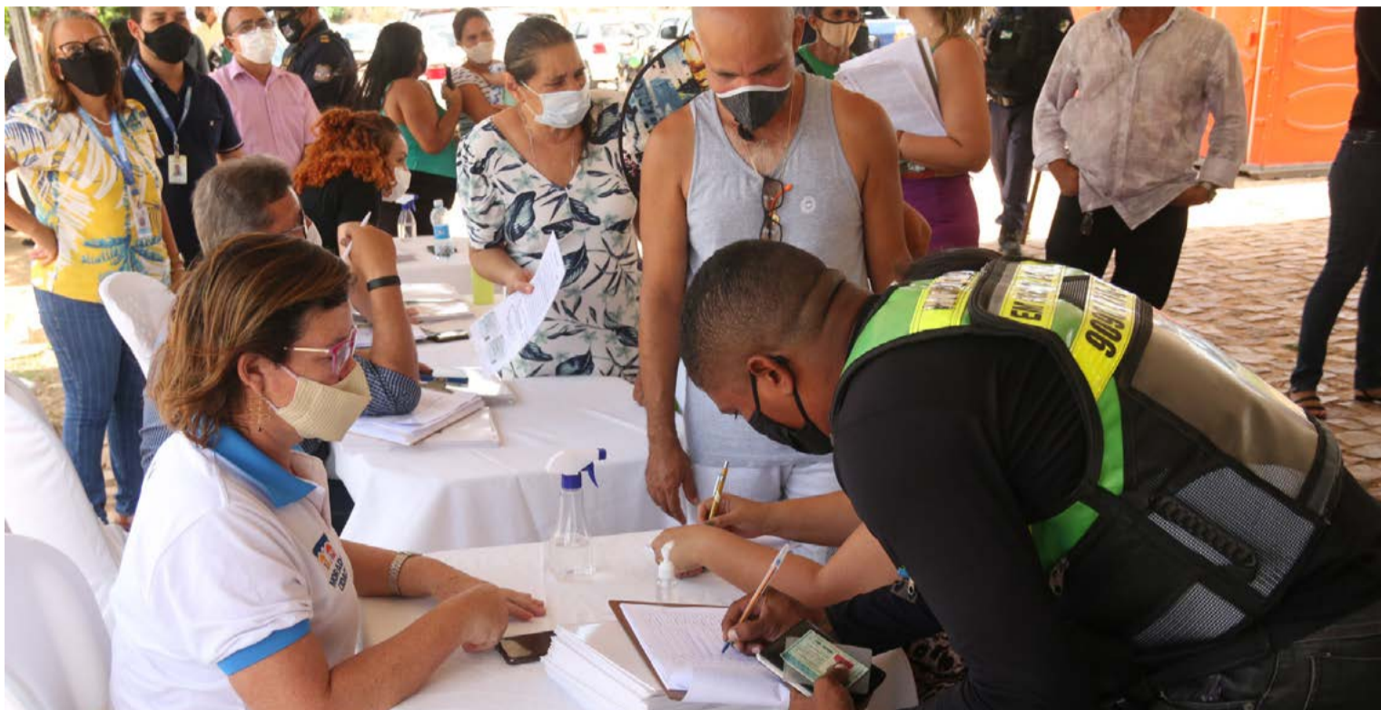
É a segunda entrega na região, já que em setembro do ano passado 105 títulos foram destinados ao conjunto Eldorado, no bairro de Pajuçara