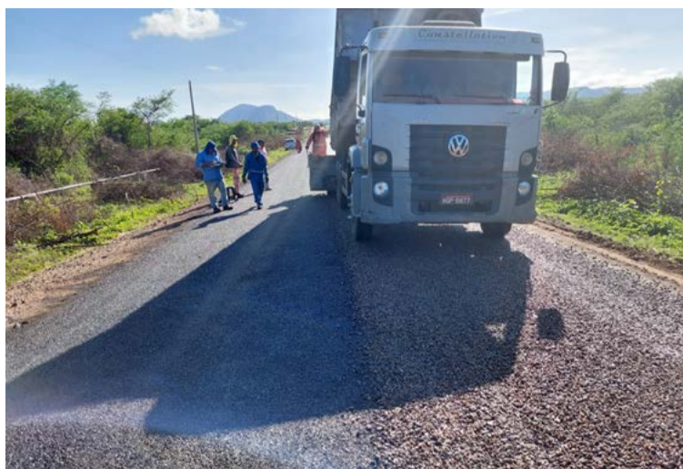
Trecho recuperado tem aproximadamente 4 km a partir da RN-118