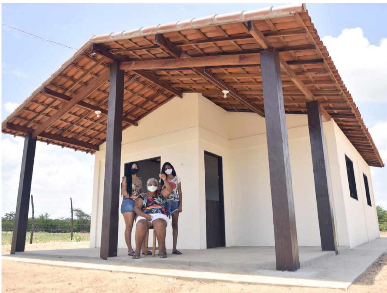
Casas entregues têm 58 metros quadrados de área construída, com dois quartos, sala, cozinha, banheiro e alpendre