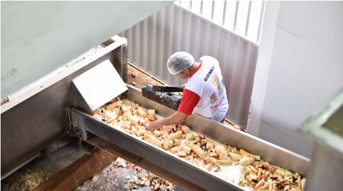
Maior aquecimento foi constatado na atividade extrativista, com faturamento mensal de R$ 11,1 milhões