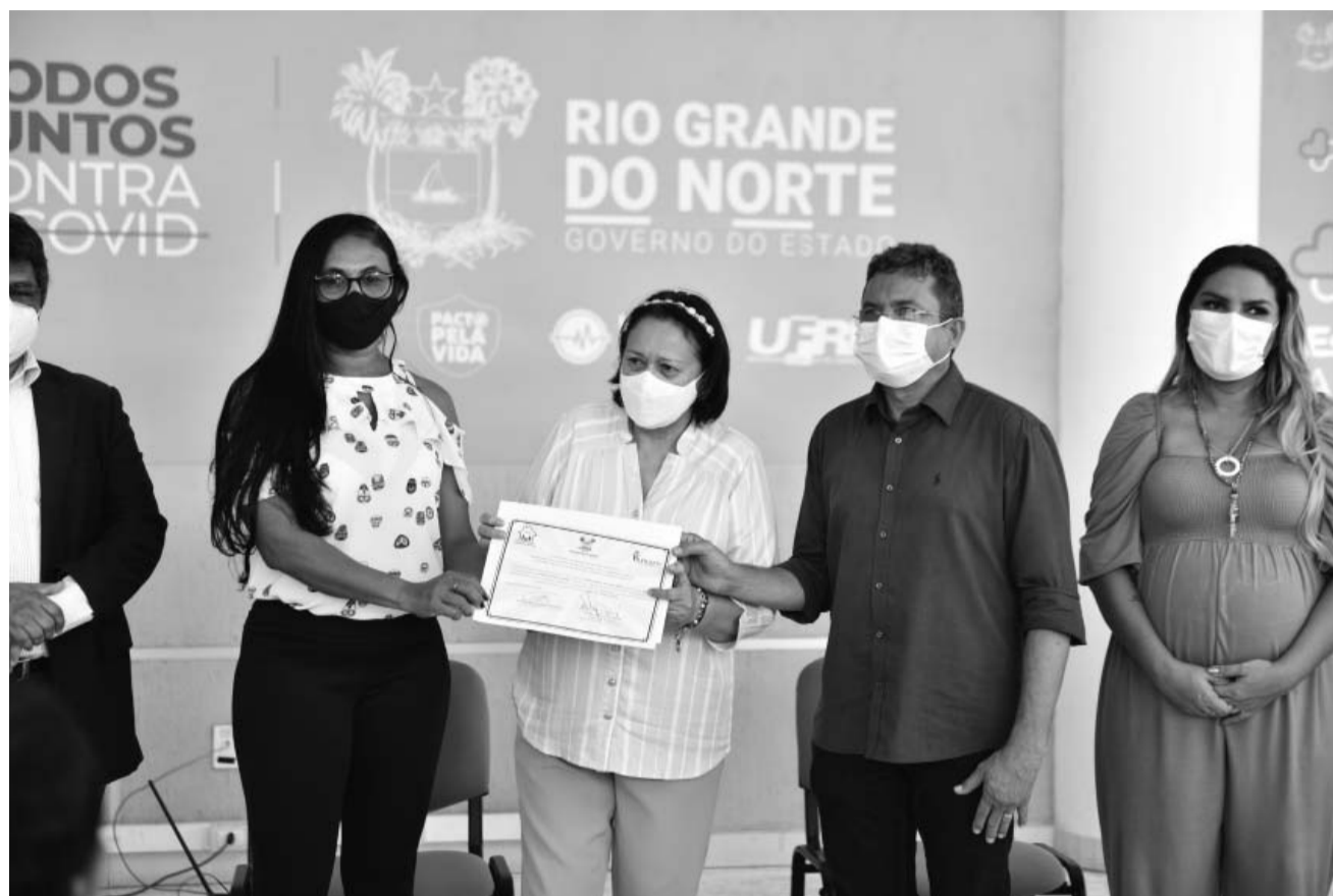
Ação do Governo do Estado proporciona segurança jurídica às famílias, tornando a habitação um bem de gerações