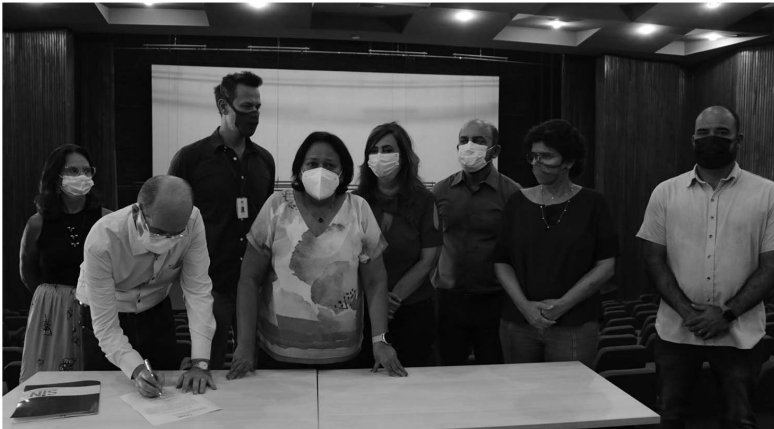
Ato de assinatura da ordem de serviço para adequação de acessibilidade do Auditório Wilma Maia e para realização de serviços na estrutura do Centro de Convenções

“Esse é mais um espaço importante para a promoção do turismo, essa que é uma atividade fundamental para a