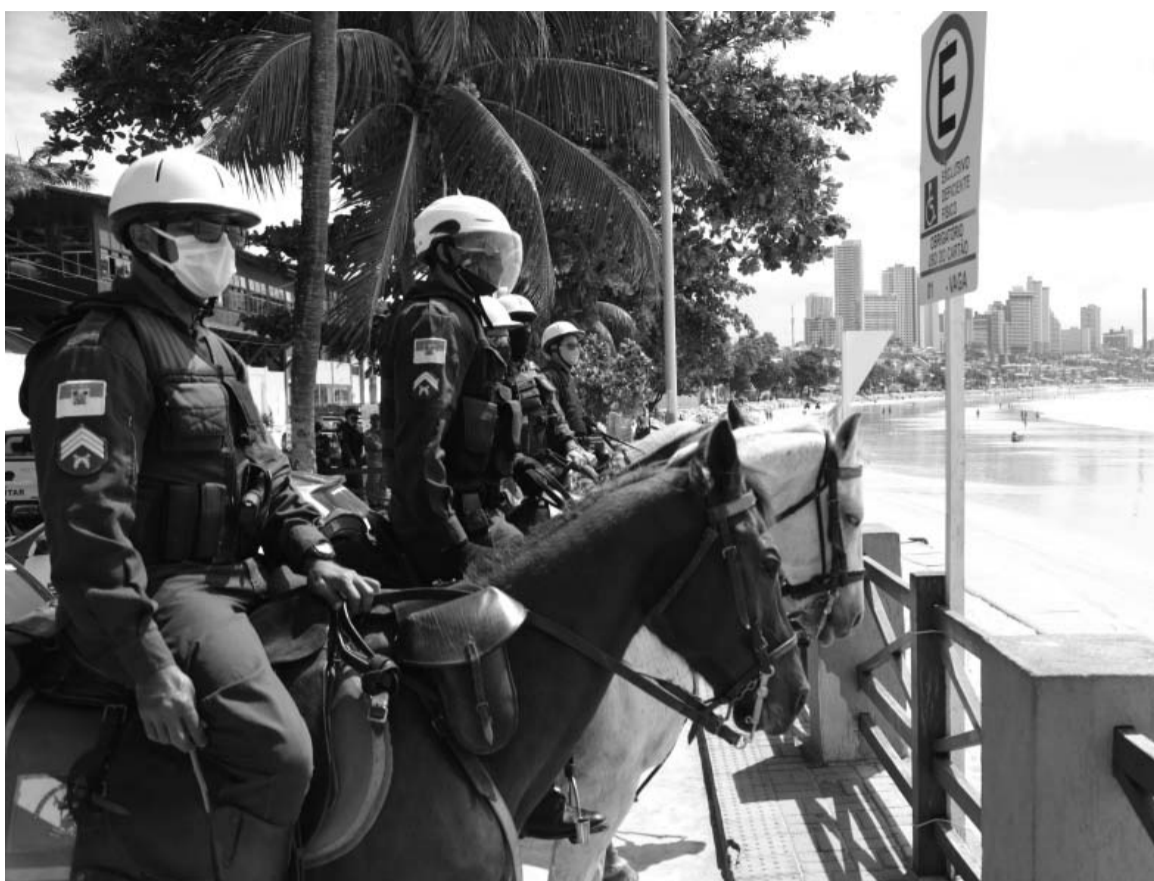
Trabalho integrado das forças de segurança pública no RN tem apresentado resultados bastante significativos