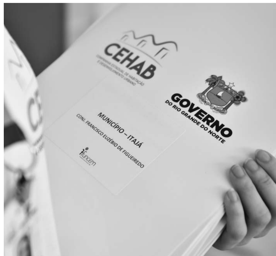
Cerca de 9.200 pessoas foram beneficiadas com a Regularização Fundiária entre junho e dezembro de 2021