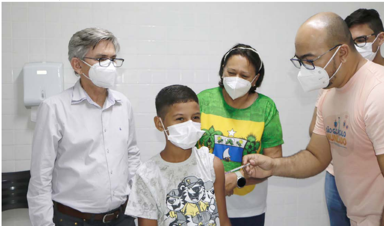
Governador Fátima Bezerra e o secretário de Saúde do RN, Cipriano Maia, iniciaram imunização no último sábado (15)