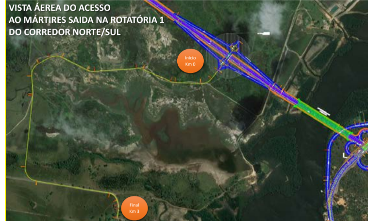
Nova ponte terá acesso nas proximidades da av. Mor Gouveia

lidade por muito tempo, pedindo estudos, projetos e, agora, viabilizando os recursos para uma obra de excelente custo-benefício, e que vai transformar o nosso monumento em um centro de visitação católica favorecendo o turismo religioso pela facilidade de acesso. Tanto de Natal quanto turistas de fora que também estamos criando uma nova rota, mais curta e mais rápida ao Aeroporto Internacional passando pelos