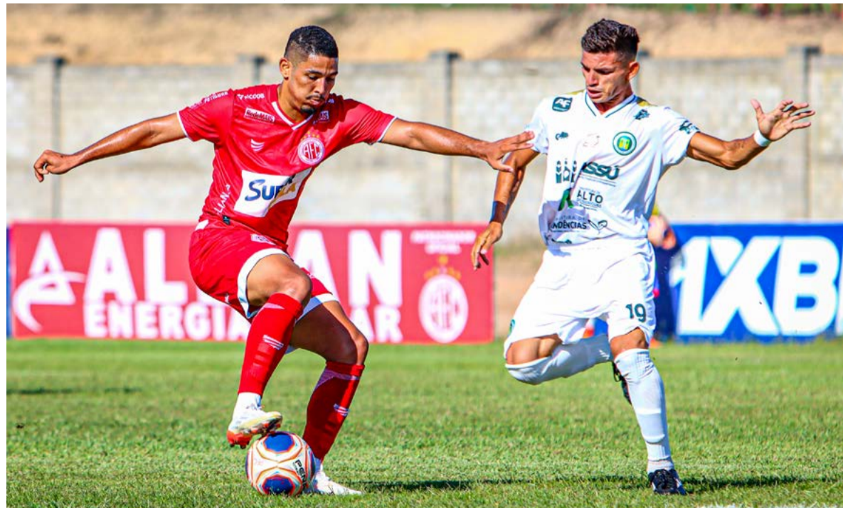
Alvirrubro jogará na próxima quarta-feira (19) contra o Globo