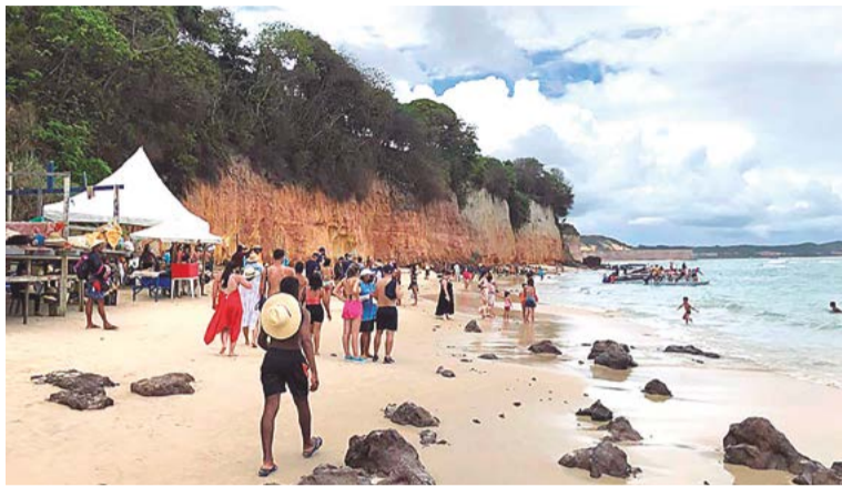
Nos fins de semana, movimento é grande próximo às falésias

O desastre ocorrido na primeira semana do ano na cidade mineira de Capitólio, onde uma placa rochosa se despreendeu dos cânions típicos da região e acabou matando dez pessoas que estavam em barcos no Lago Furnas, deixou todo mundo em alerta novamente. Em Pipa, o medo de novas vítimas ainda existe, e estudos estão sendo feitos desde o desabamento de 2020, no intuito de mensurar os riscos e evitar