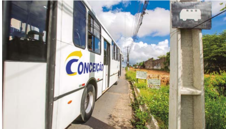
Greve foi aprovada na semana passada pelo Sintro/RN

A categoria reclama de dois anos sem reajuste salarial e do valor reduzido do vale-alimentação. O movimento cobra o retorno do pagamento integral do benefício, que antes correspondia a R$ 360, mas hoje recebem apenas R$ 180.