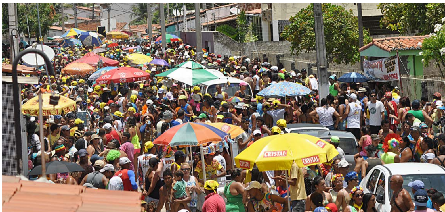
Festa foi suspensa na última quarta-feira (12) pelo prefeito Álvaro Dias, devido os altos índices de Covid-19 e influenza

“Claro que teve a participação do comitê científico, mas a princípio nós não vemos motivos para o cancelamento do carnaval. Vamos avaliar e acompanhar, mas eu acredito que poderia ser revista esta posição em função dos dados que nós temos”, opinou Max.