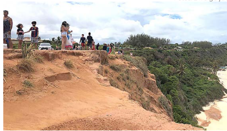
No Chapadão, pessoas disputando espaço com veículos