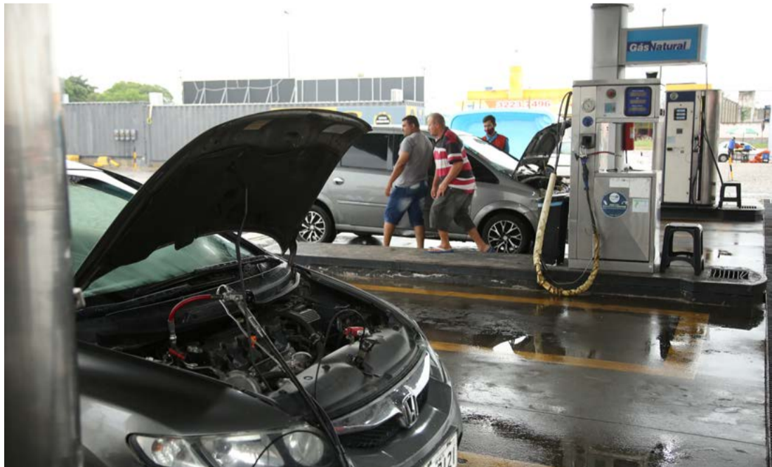
Aumento no preço da gasolina influenciam busca pela conversão para gás natural