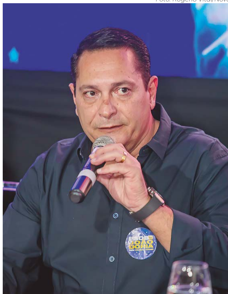
Ezequiel poderá ter apoio dos prefeitos de Natal e Mossoró