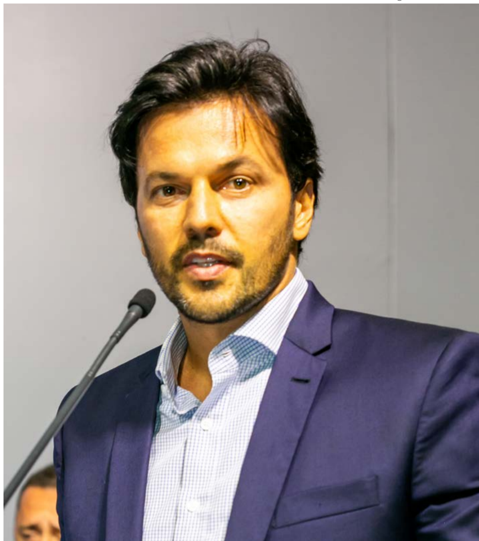
Fábio Faria vive bom momento e também quer ser candidato ao Senado