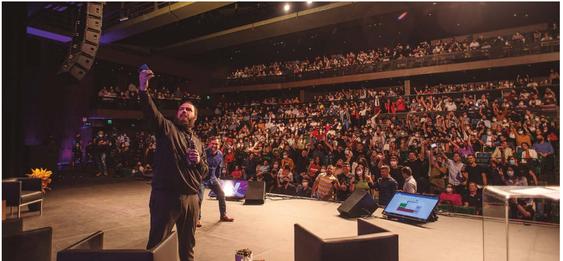
Um dos principais nomes do empreendedorismo na atualidade, Tiago Nigro, o "Primo Rico", apresentou umas das palestras mais concorridas do Fórum