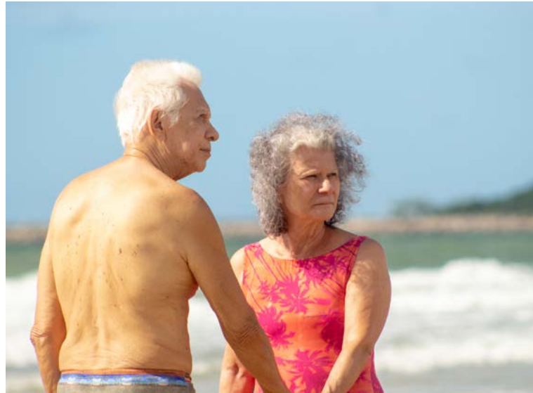
“Destinos” conta a história de amor de um casal de idosos

Os documentários “Lalá” (cor/p&b, 15’23”, 2020) e “Carneirinho de Ouro – Ode à Boêmia Natalense” (cor, 17’55”, 2021) também compõem o cardápio da Mostra. De acordo com Paulo Dumaresq, o ponto de interseção entre os dois curtas-metragens é a memória afetiva, tanto das personagens como do histórico Clube e Bar Carneirinho de Ouro, por meio de depoimentos.