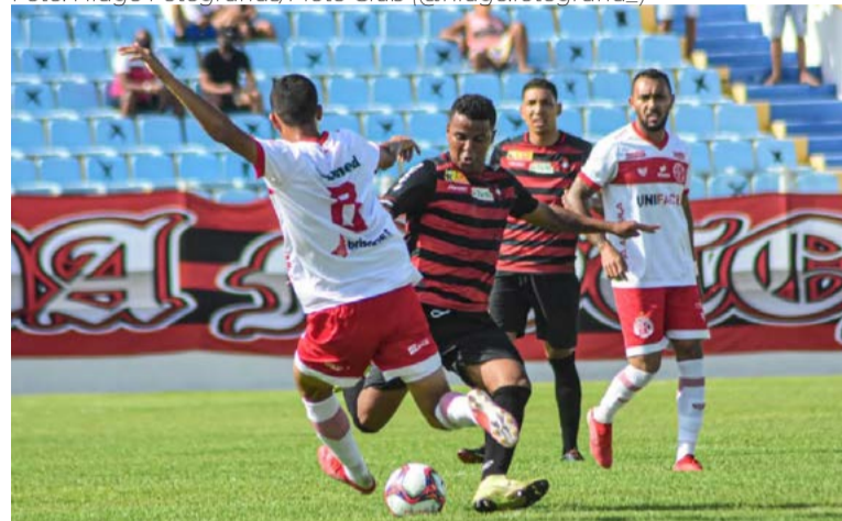
América venceu equipe do Moto Clube em São Luís (MA)

rica-RN derrotou o Moto Club mais uma vez. O Mecão bateu a equipe maranhense pelo placar de 4 a 2. O jogo da ida em Natal, o Alvirrubro já tinha vencido o Papão por 1 a 0.