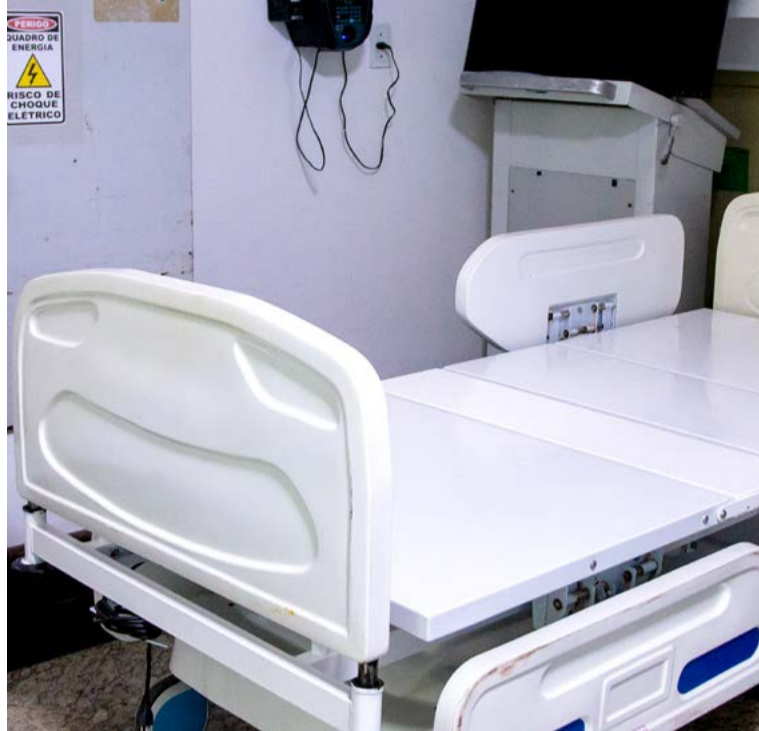
Controladoria elaborou relatório sobre a SMS e a Sesap

pago mais de R$ 1,1 milhão pela (SMS) de Natal por plantões Secretaria Municipal de Saúde médicos com adicional covid