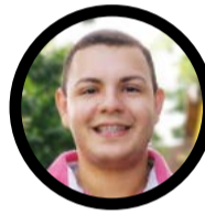
KEVIN MUNIZ REPÓRTER @kevinmuniz

rica-RN derrotou o Moto Club mais uma vez. O Mecão bateu a equipe maranhense pelo placar de 4 a 2. O jogo da ida em Natal, o Alvirrubro já tinha vencido o Papão por 1 a 0.