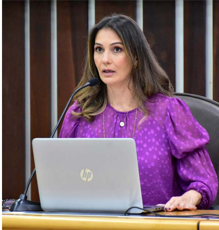
Deputada votou a favor de reajuste de imposto em 2015

Rio Grande do Norte arrecada, atualmente, R$ 1,94 a cada litro de combustível vendido com a alíquota de 29%; por isso, ela enviou à Secretaria de Tributação do RN um requerimento solicitando a redução. “É uma arrecadação alta no valor final do combustível imposto aos motoristas”, argumenta ela.