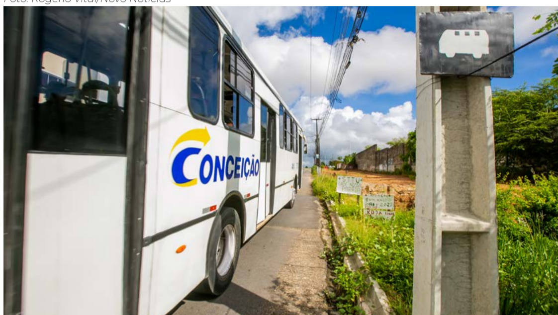
Nova Rede de Transporte Público alterará itinerário de algumas linhas nos bairros

tinuar participando ativamente para que a Secretaria de Mobilidade Urbana repasse todas as informações para o corpo técnico realizar as proposituras”, afirmou o secretário.