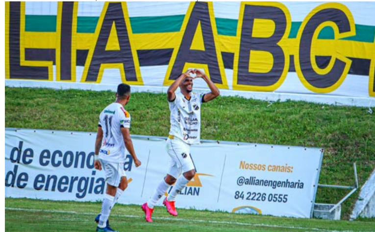
Equipe potiguar pressionou clube do Piauí no 1º tempo