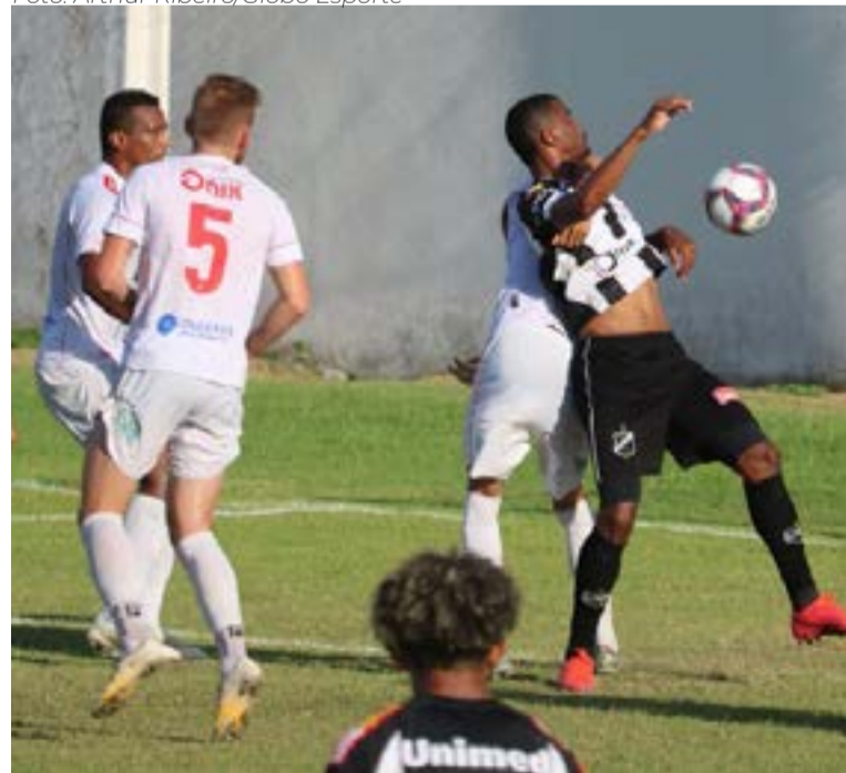
ABC arrancou empate no segundo tempo

Os técnicos utilizaram as 10 substituições, porém o placar seguiu mesmo empatado por 1 a 1. Com o resultado, quem vencer na