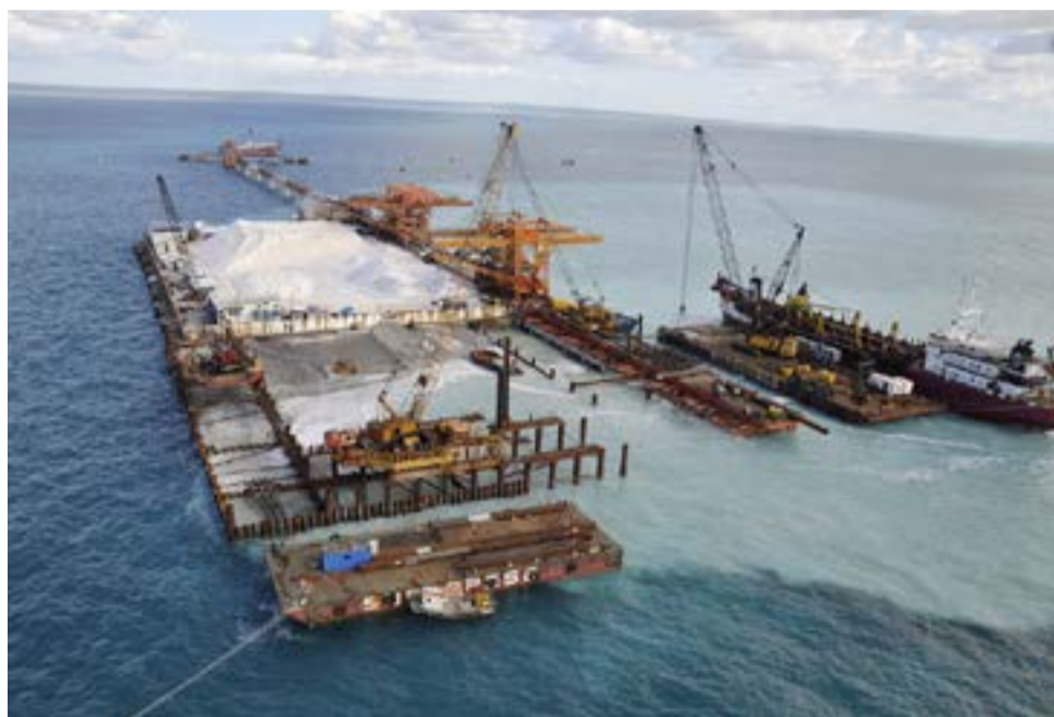
Terminal é o principal ponto de escoamento da produção de sal do RN

para diversas atividades, incluindo o apoio técnico à indústria de energia eólica, servindo de ponto de apoio para a construção de parques eólicos offshore, como um porto-indústria.