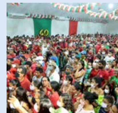
Convenção do PSB em Guimarães