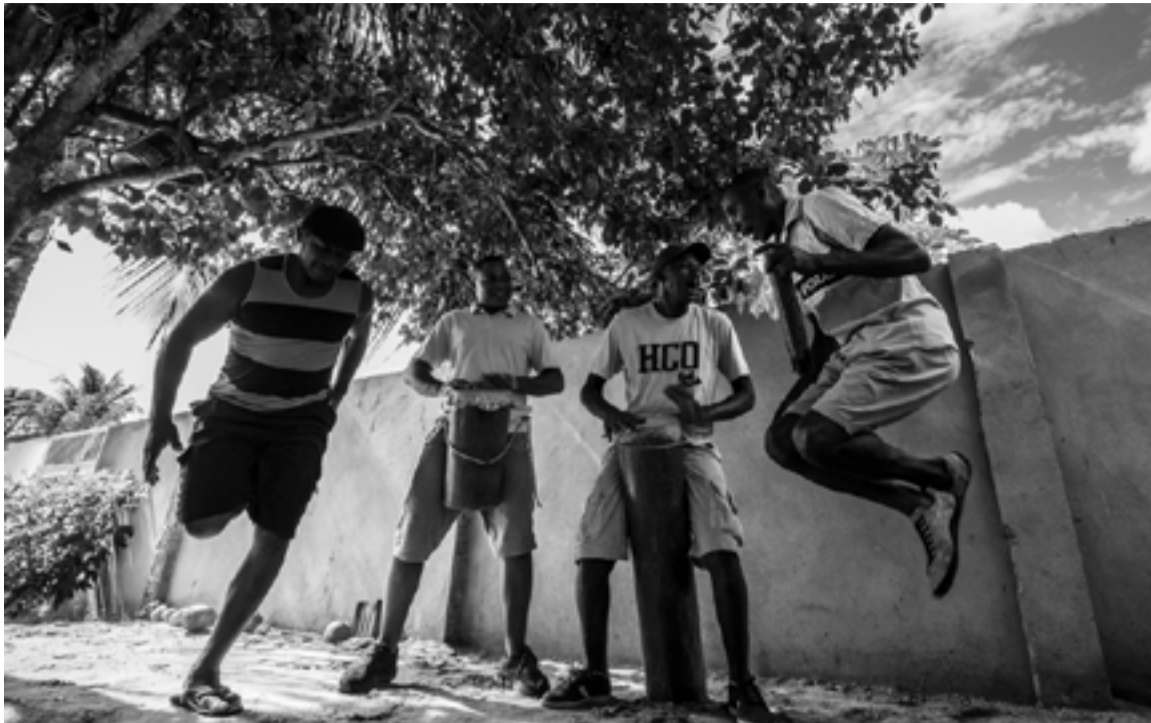
Comunidade Capoeiras, em Macaíba, tem seus costumes e tradições resgatados em fotos e vídeo