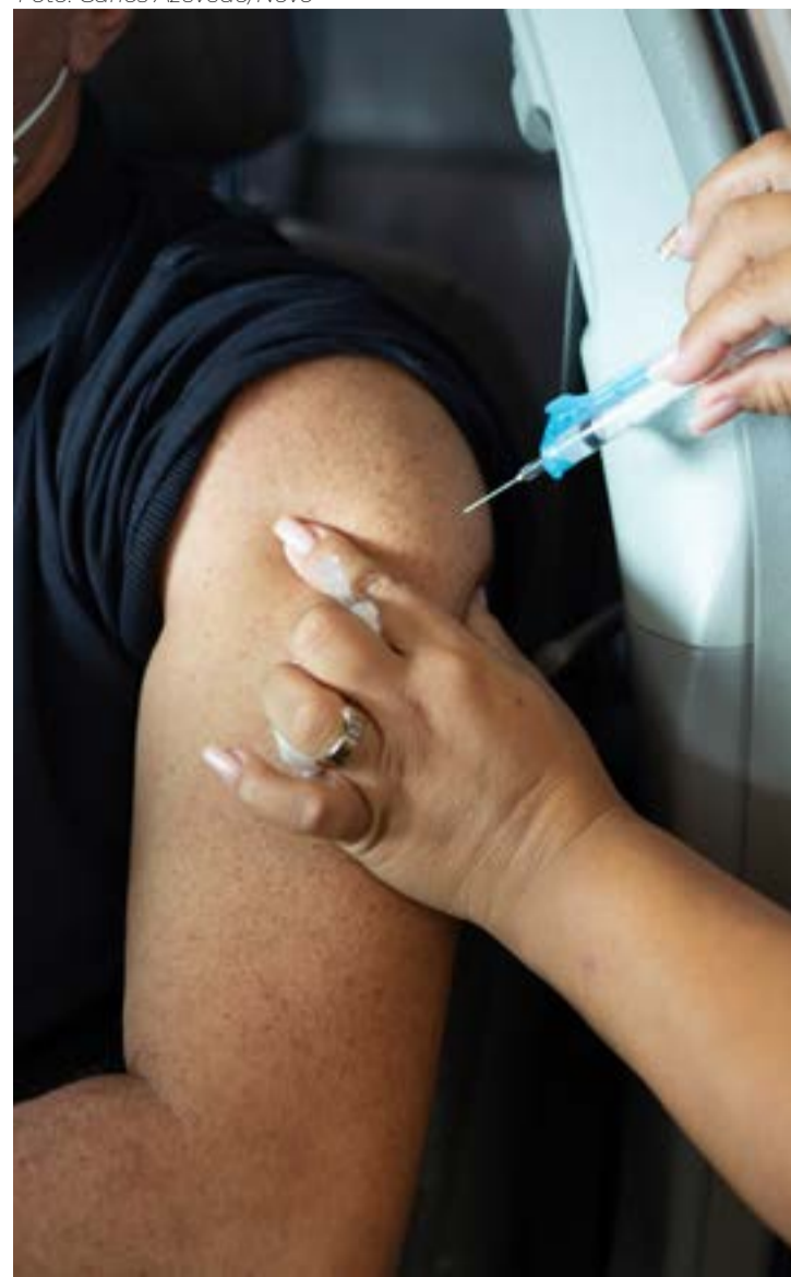
Apesar da queda dos casos, cuidados ainda continuam