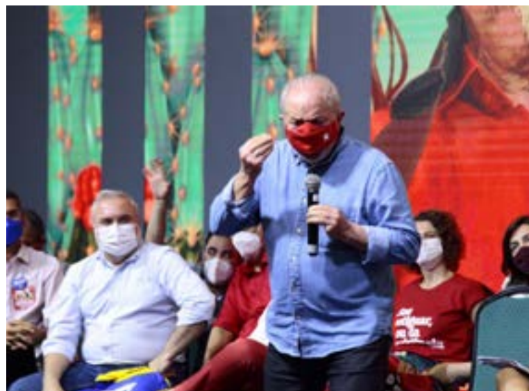
Ex-presidente Lula veio em busca de novas alianças políticas