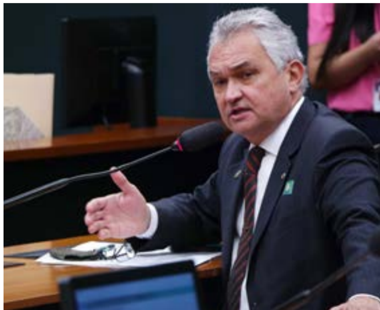
General e um dos incentivadores dos atos do dia 7

“No Brasil, como reação ao regime autoritário instalado no passado ainda próximo, a Constituição de 1988 estabeleceu, no capítulo relativo aos direitos e garantias fundamentais, que ‘constitui crime inafiançável e imprescritível a ação de grupos armados, civis e militares, contra a ordem