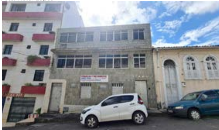
Prédio em Salvador está com placa de oferta de aluguel