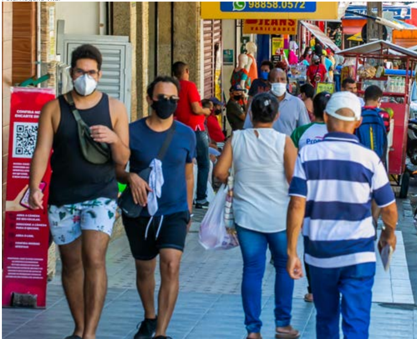
Avanço da vacinação tem favorecido a retomada econômica