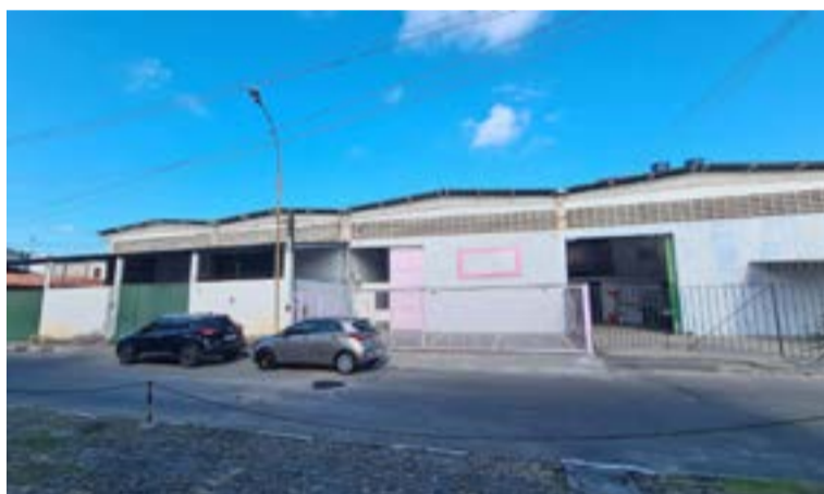
Em Lauro de Freitas, endereço abriga quatro galpões