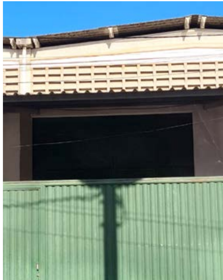
Reportagem do NOVO encontrou galpão com portas fechadas