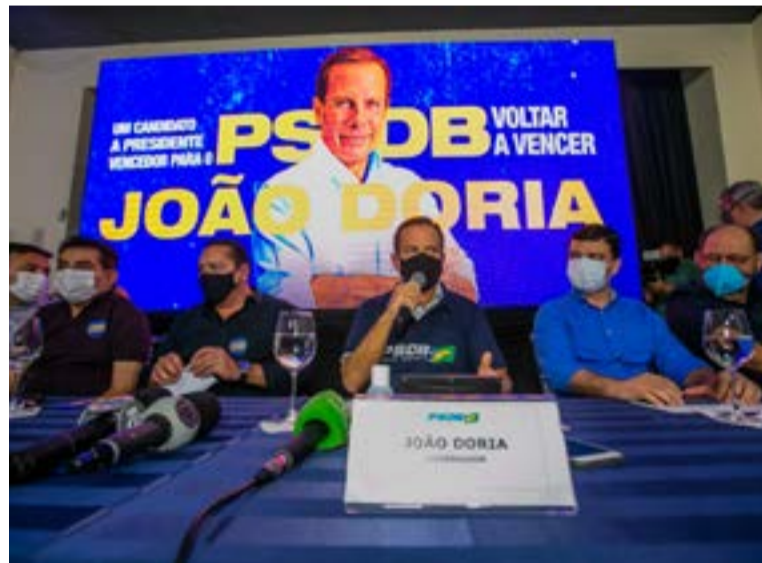
João Doria reuniu PSDB na última sexta-feira, em Natal