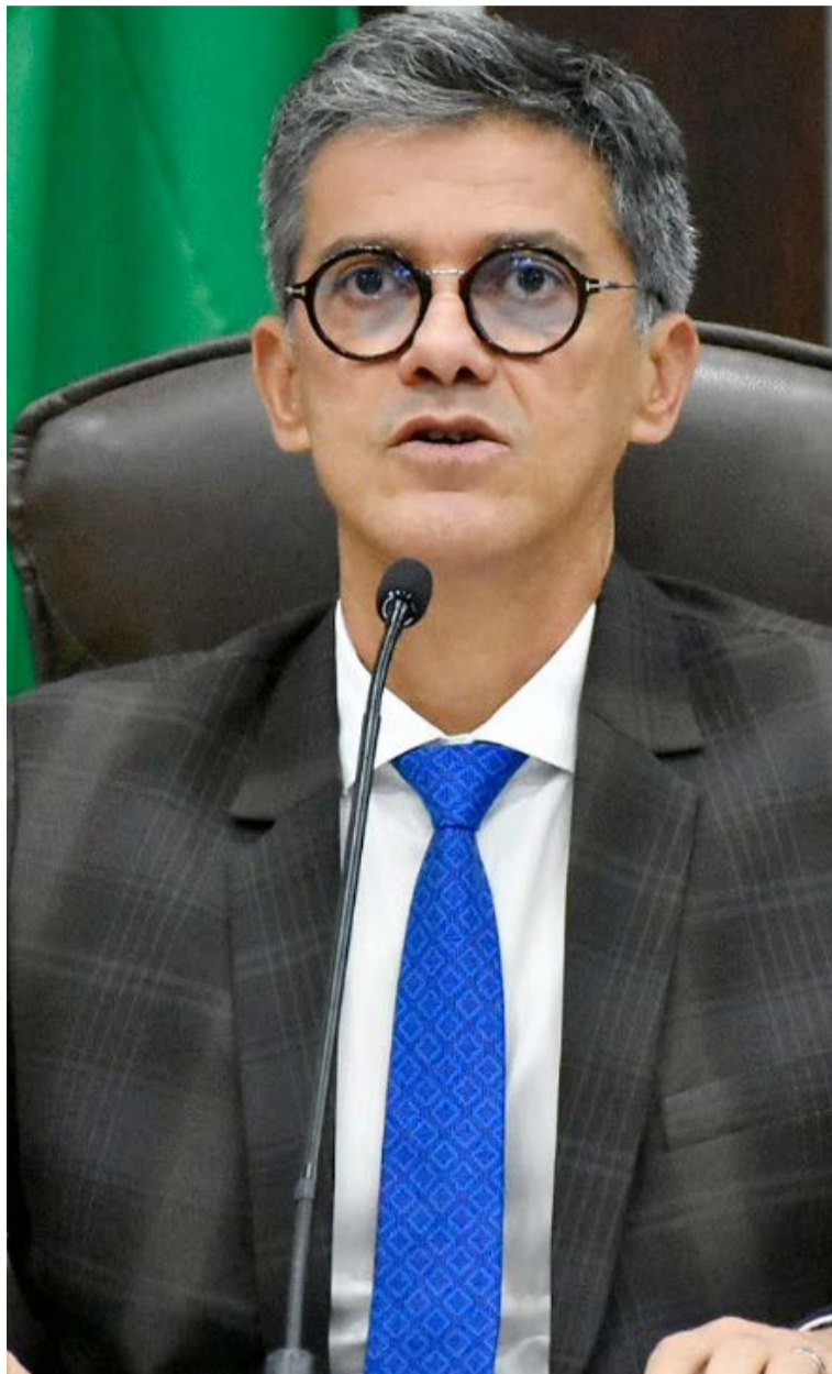
Cel. Azevedo acusa STF de ajudar Lula a concorrer a eleições

depois que as condenações fossem transitadas em julgado no STF. Eu lamento muito isso aí", disse o deputado.