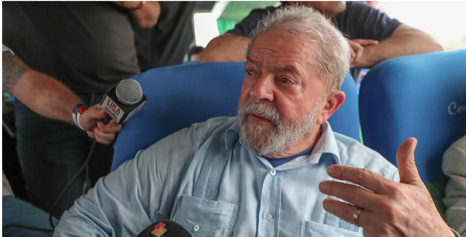
Objetivo da passagem de Lula pelo RN é reforçar o diálogo com lideranças locais visando apoio e alianças para eleições de 2022

Entre muitas visitas e reuniões, o ex-presidente deve reforçar pautas, como a retomada do desenvolvimento do Nordeste, e projetos de combate à fome. O senador petista Jean Paul Prates, que tem auxiliado Lula na montagem de sua agenda de compromissos durante esta passagem, demonstrou otimismo com a presença do político no estado. "A vinda de Lula ao Rio Grande do Norte é um aceno de esperança ao povo potiguar diante