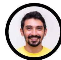
JAQUEILTON GOMES REPÓRTER @Jaquiltongs

de descaso na execução de obras dos governos do PT, assim como a falta de segurança hídrica e de integração de bacias que nunca foi feito aqui no RN", diz o deputado Coronel Azevedo, que completa: "estamos vivendo outra época. Um tempo de eficácia nos serviços públicos, pleno vapor das obras, apesar da pandemia, e deixando para trás esse histórico de denúncias de corrupção e obras mal feitas e inacabadas".