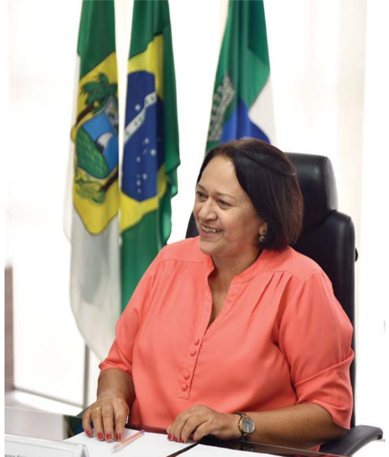
É preciso avançar no perfil de um projeto democrático