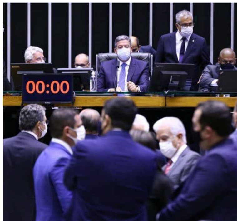
Proposta de deputados prevê penalidades administrativas