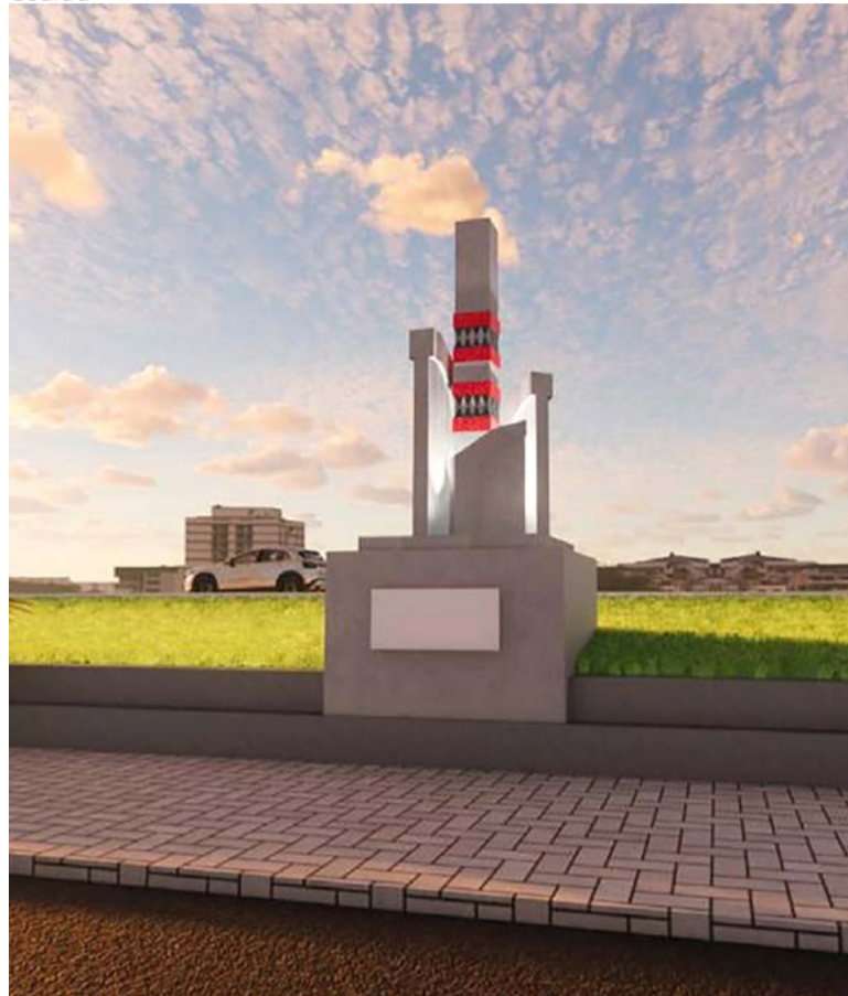
Com 6 m de altura, escultura será financiada pelo setor privado