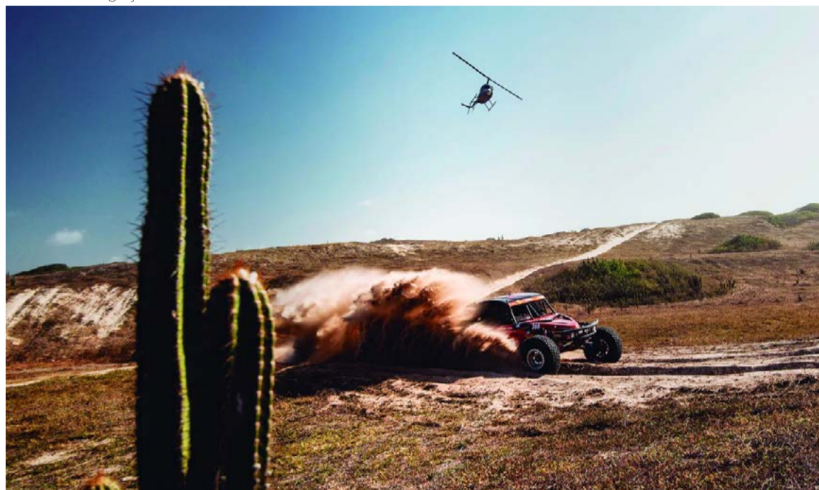
Serão 3.548 Km de percurso, com início em Pipa e chegada na praia dos Carneiros (PE)