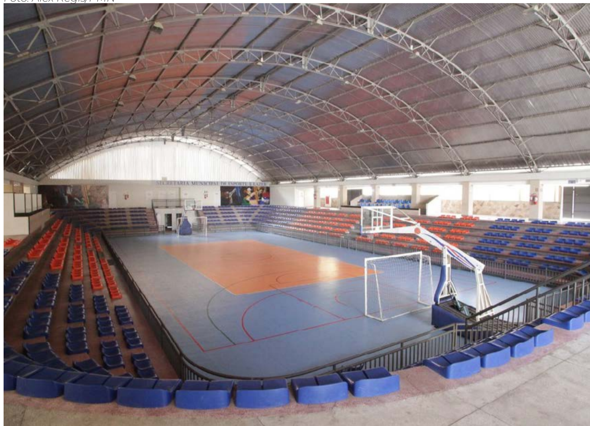
Palácio dos Esportes é uma das opções para sediar os jogos da Funvic na Superliga

Em Natal, a equipe tem duas opções para mandar seus jogos: o ginásio Nélio Dias, localizado na Zona Norte, e