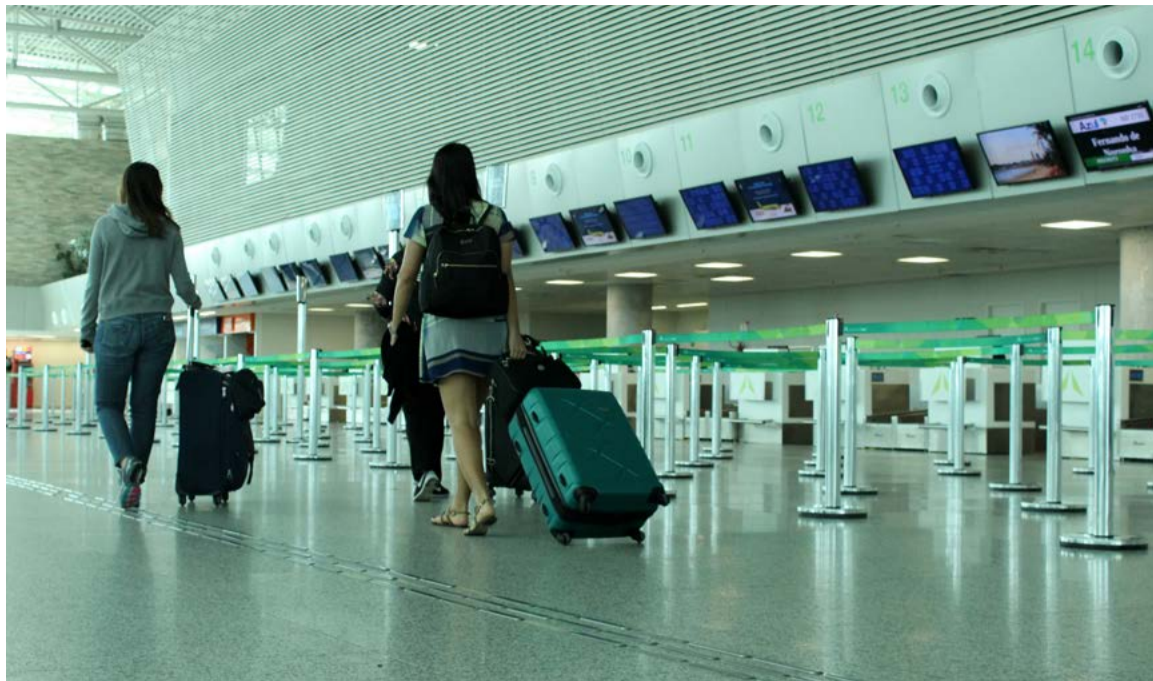
Medida visa o rastreo e monitoramento das cepas em circulação no estado