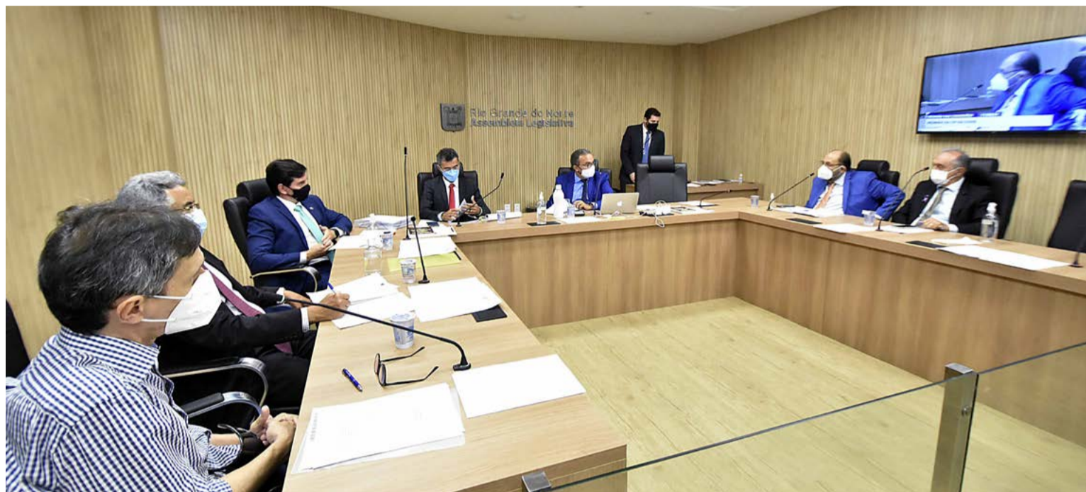
CPI abriu oficialmente os trabalhos investigativos e os primeiros contratos analisados são os de compra de EPIs