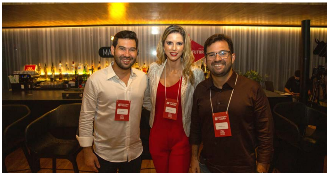
Diretores do LIDE RN e LIDE Futuro recebem convidados e associados

O LIDE Futuro RN reuniu conselheiros, filiados e convidados para um happy wine no Marechal Steak House e GrandCuru. Na ocasião, o grupo de líderes empresariais discutiu os caminhos e a oportunidade gerada a partir de investimentos em startups. Alguns cases foram apresentados. Formatos de negócios que se referem a investimentos na ordem de mais de R$ 10 milhões em startups do RN. Diversas empresas estiveram presentes, facilitando o debate. Entre elas, a Faceponto, AutoForce, CREDE-RE, Fala Síndico BR e