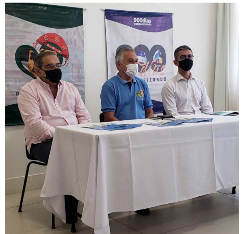
Prefeito Álvaro Dias foi questionado sobre atuação do Governo