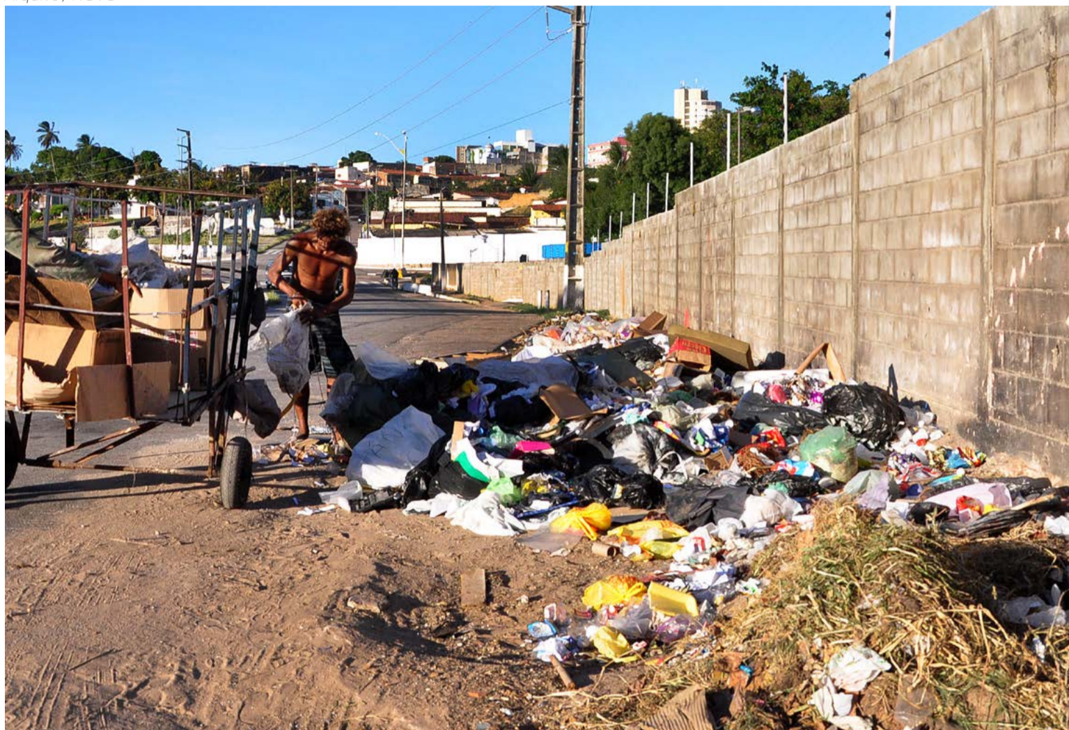
Ministério Público do RN considera inadmissível que municípios ainda descartem lixo de forma inapropriada

gou ao número de oito municípios em condições irregulares. A lei nº 14.026/20 estabelece que dia 2 de agosto de 2021 todos os municípios integrantes das regiões metropolitanas deverão encaminhar os seus resíduos para uma destinação final adequada.