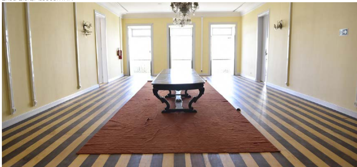
Salão nobre da Pinacoteca do Estado, cujo prédio está passando por reforma estrutural