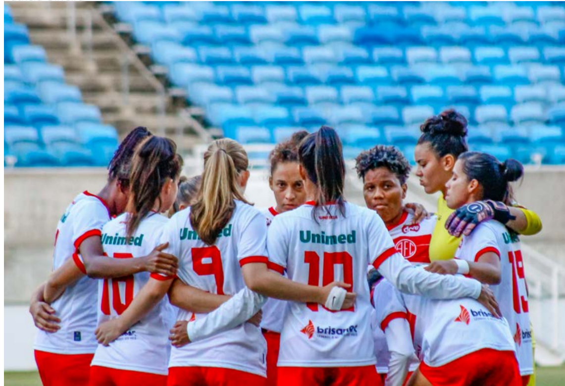
Última atividade do time feminino aconteceu dia 18 de junho no Arena das Dunas

Brasileira de Futebol (CBF) e que deve ter destinação obrigatória ao departamento de futebol feminino.