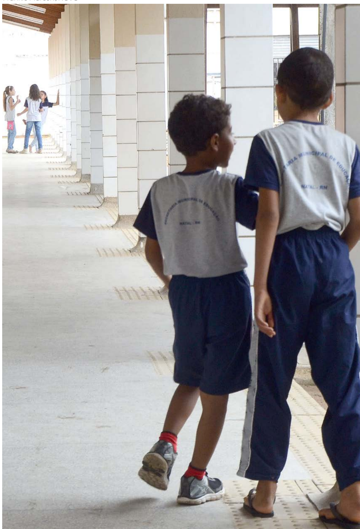
Segundo estudo, 187 mil alunos potiguares não tiveram acesso às atividades escolares em 2020