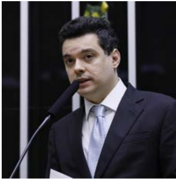
Deputado federal Walter Alves