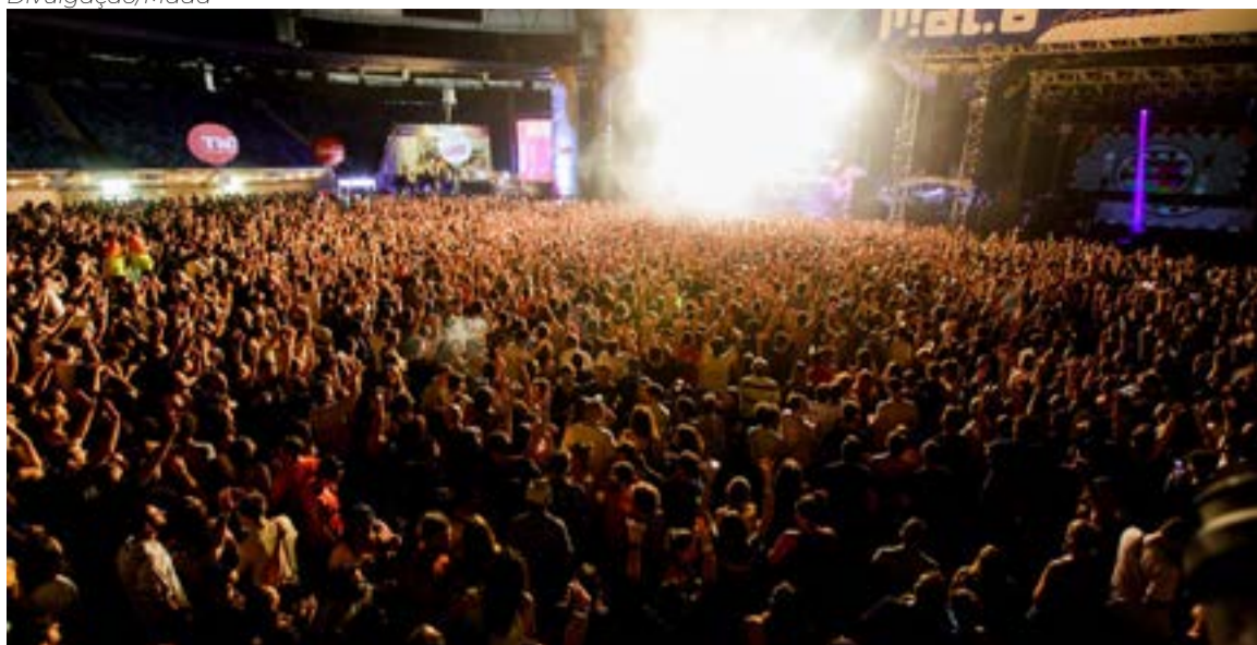
Festival Mada: ano de 2022 surge como promissor para o setor eventos e festas

vamos dar um passo além das orientações dos governos. Pode ser até que tenha Carnatal em 2021, de forma diferente, menor, não sei ainda, mas nada será feito sem a autorização do governo. Temos adotado essa postura há mais de um ano”, resalta Bezerra.