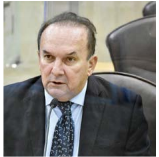
Deputado estadual Nélder Queiroz