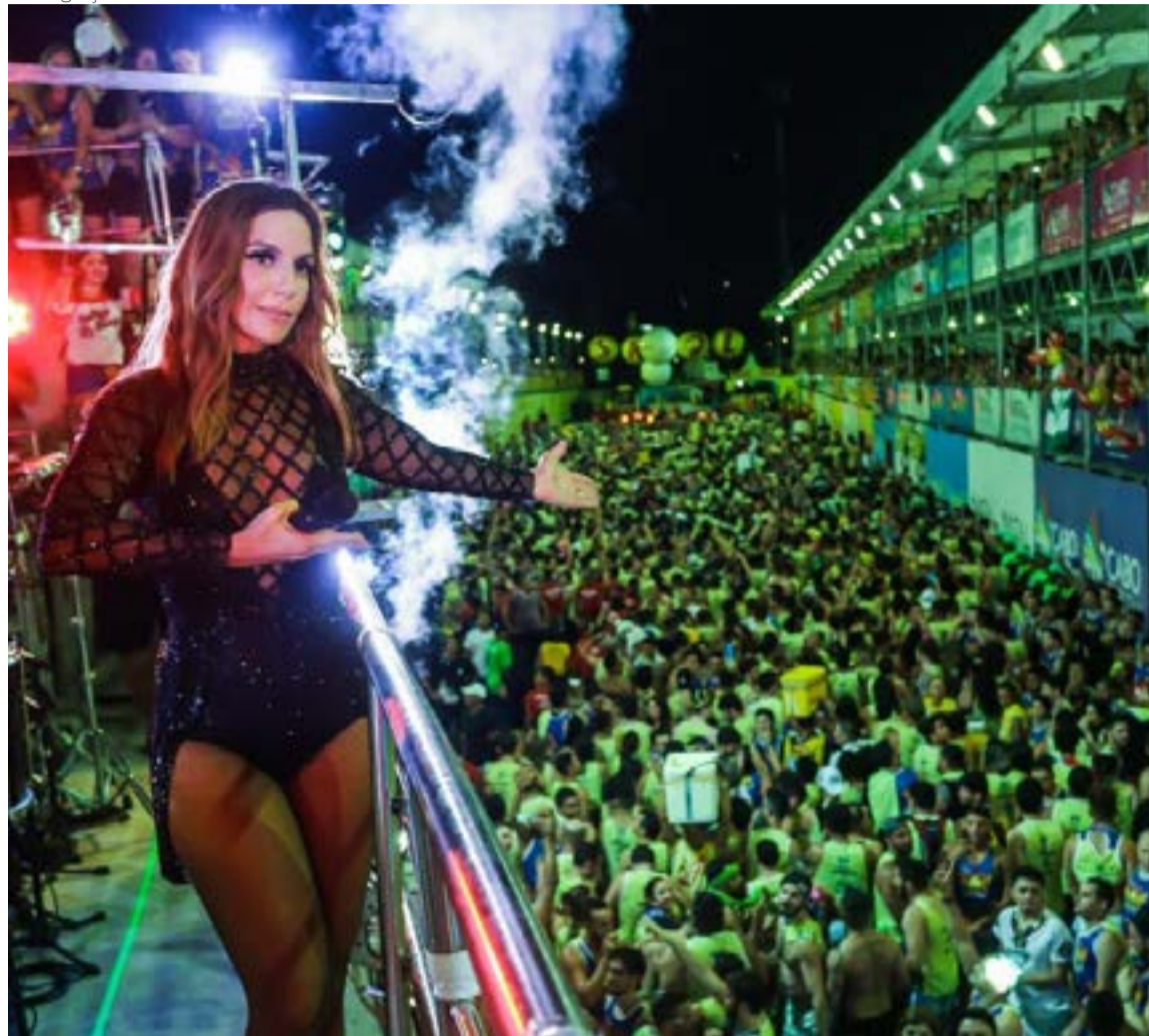
Diretores Carnatal conversam com o Governo do RN para tratar a volta da festa