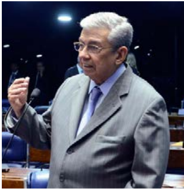
Ex-senador Garibaldi Alves Filho